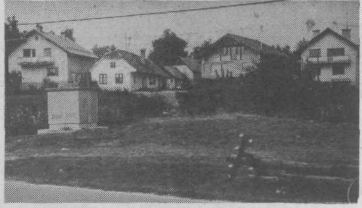
Zaloške Poljane v začetku oktobra. Mladinci OO ZSMS Zalog so se obvezali, da bodo z lokalno delovno akcijo uredili Poljane v zelenico, v prvi zaloški park. Potrebno je samo dovoziti dovolj zemlje, potem pa lopate v roke!