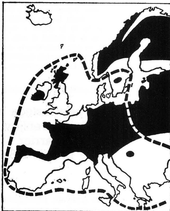
Slika 2: Gnezditvena in zimovalna razširjenost pepelastega lunja Circus cyaneus v Evropi (po Petersonu etc.)

Figure 1: Male of Hen-harrier Circus cyaneus by its prey, a Black bird Turdus merula , Hotinja vas, January 26 th , 1987 (M. Vogrin)