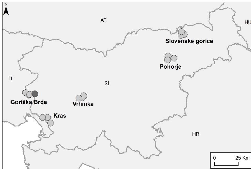
Figure 1. Location of churches included in the study. Sabotin (test location without prior illumination) is marked by a dark dot, other churches are marked by light dots.

Popisi so potekali v treh zaporednih sezonah, od 2011 do 2013. V eni sezoni je bilo opravljenih šest popisov od sredine maja do sredine septembra. Popisovati smo začeli vsaj eno uro po navtičnem mraku. Na vsakem objektu smo popisovali metulje na fasadi in okolici reflektorjev 45 minut; ta časovna omejitev nam je omogočila, da smo v eni noči obiskali vse cerkve v enem trojčku. Popisi so potekali ob ugodnem vremenu (brez dežja, rahel veter) in vsaj en teden pred ali po polni luni. Na vsaki cerkvi smo popisovali številčnost metuljev na vzorčni ploskvi velikosti 10×3 m, na drugih osvetljenih delih fasade in okoli reflektorjev pa smo zgolj beležili pojavljanje vrst. V tem prispevku prikazujemo favnistične podatke. Večina vrst je bila determinirana na terenu, druge pa so bile ulovljene in so shranjene v zbirkah avtorjev. Za določitev smo uporabili standardne priročnike za nočne metulje in Microlepidoptera (npr. Fajčik & Slamka 1998, Belin 2003, Fajčik 2003, Mironov 2003, Leraut 2012, 2014).