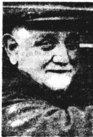
Pretečeni teden je prispel v Berlin 80 let star angleški poslanec George Lansbury, kjer se je sestal s Hitlerjem. Posetu pripisujejo za evropski mir veliko važnosti.

miru občinske volitve. Tožbe na upravno sodišče so dale priliko, da je bila tudi sodniško ugotovljena nespornost volilnega izida. Toda gotovim ljudem to ni prav. Očitajo si, da niso bili dovolj spretni in da bi se izplačalo poskusiti stvar še