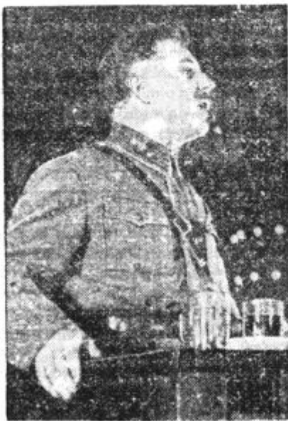
Stalin, ki vodi Rusijo k demokraciji

V zadnjem času je nastalo v evropski politiki važno preusmerjenje, ki ga je povzročila izredna delavnost italijanske diplomacije. Ta stremi z vsemi napori za tem, da kar največ držav spravi v svoje interesno območje.