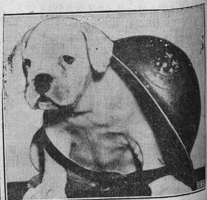
Šest tednov stari angleški "bulldog" izgleda nekaj precej pčrt, ker ga menda precej teži velika čelada. On je zelo popularen "mascot" v nabornem uradu ameriških mornaric v Clevelandu.