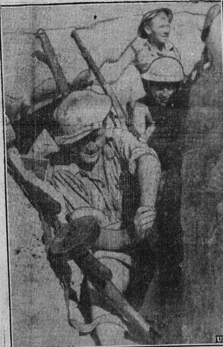
Kljub nevarnosti se fantje dobro počutijo v strelskih jarkih, ki so komaj 400 jardov oddaljeni od sovražnih vrst v vročih krajih Tobruk-a v Libiji.