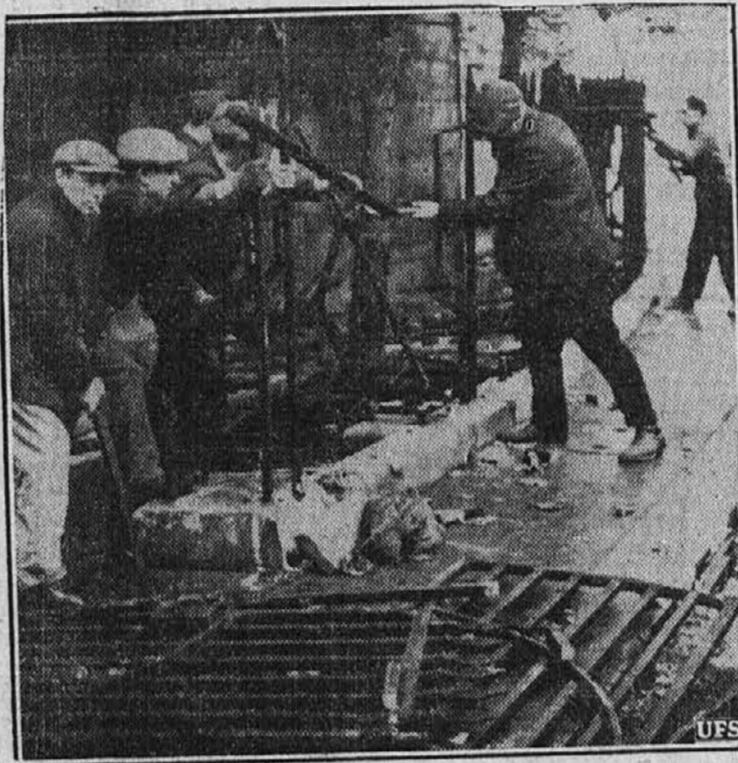
Prispevek zadnjega časa za narodno obrambo je ograja zgodovinske londonske cerkve sv. Klemenca, ki je bila poškodovana tekom nemških napadov na London.

Na obrazu sodnika Galpina se ni genila niti ena mišica. Kot bi bilo zadnje vprašanje stavljen na koga družega, reče s hladnim glasom: