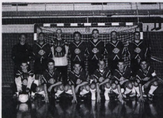
La squadra di calcetto "Circolo"