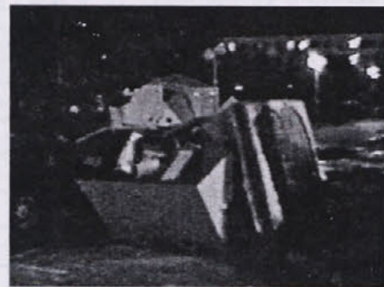
Ponoči se kontejnerji napolnijo do vrha

Že v prvem tednu je zgornji plato deponije, namenjen še uporabnim predmetom, bogatejši za nekaj pralnih strojev in hladilnikov, termoakumulacijsko peč in električni štedilnik, ki so jih občani oddali sami ali pa so za to poklicali delavce komune. Po krajevnih skupnostih Jagodje in Livade bo jesensko čiščenje na vrsti v Kortah in v zaselkih po podeželju, kjer se bo akcija pričela 23. oktobra in zaključila 29. oktobra.