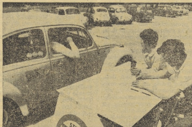
Na časovni kontroli v Celju so se vozniki okrepcali