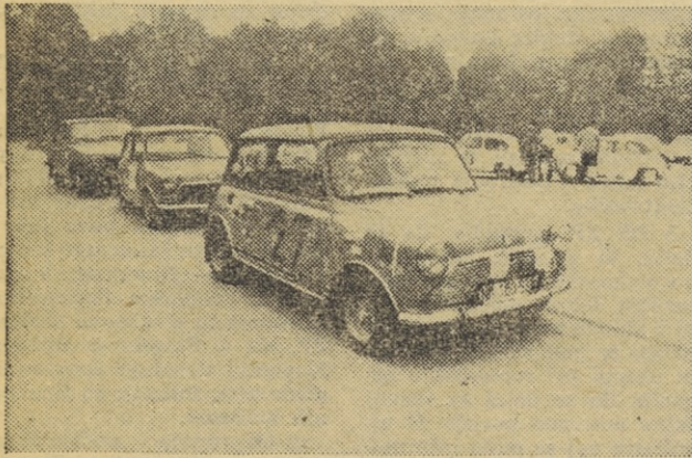
Novomeški »mini« je bil to pot najbolj »okrancljan«