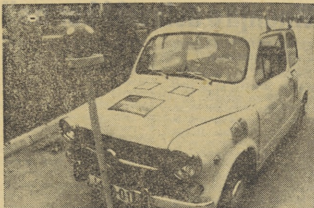
Ob dotiku je žoga morala ostati na stojalu