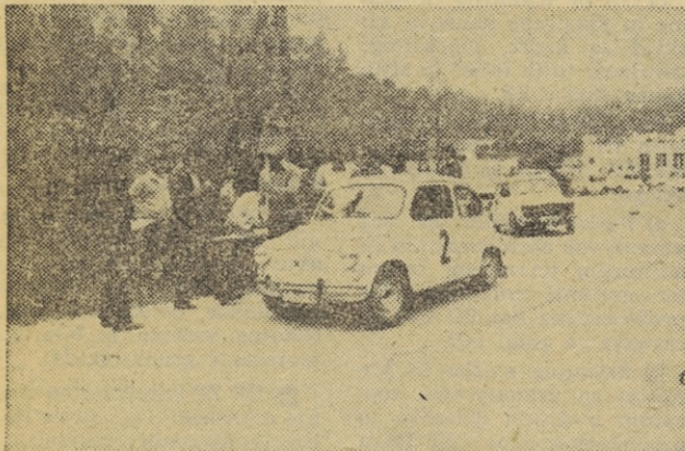
Na točnostno vožnjo se odpravlja tekmovalka iz Gorice

iocenega kraja, prepisati napis na drugem spomeniku in se slednjič javiti na kontroli pred menzo Elektromehanike v Kranju.