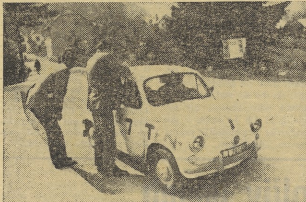
Prvi tekmovalci na kontroli pri igrišču v Škofji Loki