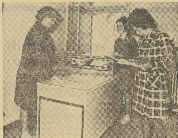
MILIJONTA KOPIJA NA XEROXU

Poleg razstave bo Unitra v istem času organizirala tudi vrsto seminarjev s področja elektronske opreme za široko potrošnjo, s področja profesionalne elektronske opreme, razvoja proizvodnje diskretnih polprevodniških elementov in mikroelektričnih integriranih vezij itd.