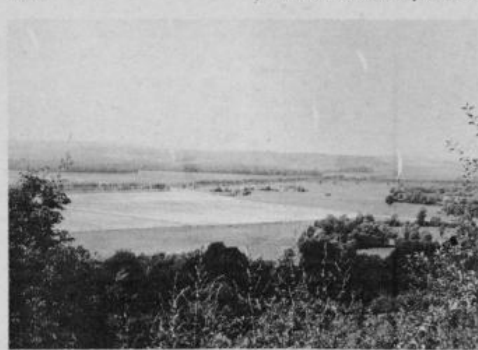
Plesniška dolina je posebno primerna za pridobivanje sladkorne pese.

sredni bližini Ormoža na ravnini znotraj proge Ormož-Ljutomer. V neposredni bližini teče reka Drava, ki je obremen vir tehnološke vode. Zazidalno območje meri od 30 — 40 ha.