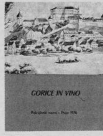
Naslovna stran knjige.

trsničarstvo in sadjarstvo — tega, kar prihaja že počasi v pozabo. Želeli smo posvetiti nekaj vrstic tudi tistim vinogradnikom, ki jih že dolgo ni več, vendar so veliko