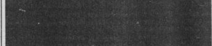
Maketa blagovne hiše v Ormožu. Projektant blagovnice je Dušan Moškon.

Zamisel o gradnji blagovne hiše v Ormožu sega že v preteklo srednje-ročno obdobje. Med delovnimi ljudmi in občani je že dalj časa veliko zanimanja za gradnjo trgovskega lokala, kjer je mogoče kupiti več stvari. Ker Ormož nima takšnega trgovskega lokala odteka določen del kupne moči v nekatere sosedne občine, kot recimo v Ptuj, Maribor in Ljutomer; tudi za same kupce je takšen lokal nujno potreben, zato so se v Ormožu odločili, da v tem srednjeročnem obdobju zgradijo sodoben trgovski lokal.