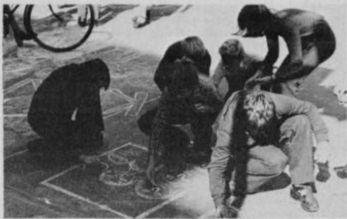
Učenci pri pomembni izvenšolski akciji za referendum lansko jesen.