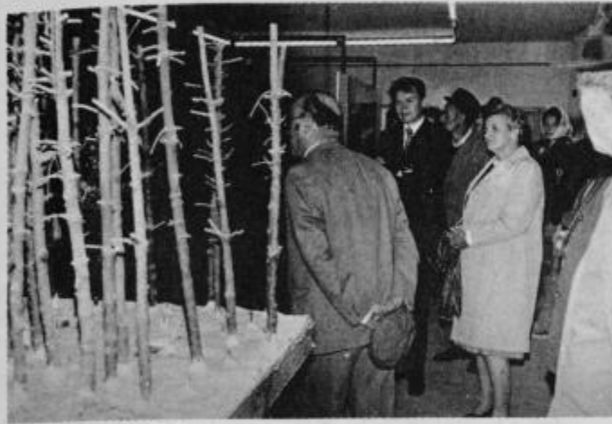
Notranjost muzeja NOB na Osankarici.