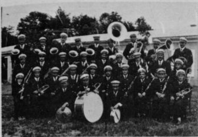
Pihalni orkester delovnega kolektiva IMPOL.