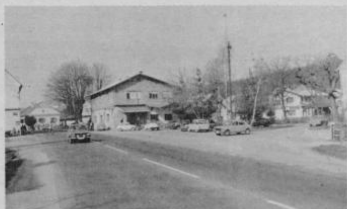
Nedavno asfaltirana ulica v Slov. Bistrici