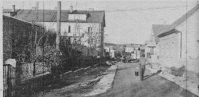
Motiv iz Zg. Polskave

Med najboljše organizirane KS na območju občine Slovenska Bistrica nedvomno spada KS Zg. Polskava. Poleg dejavnosti in družbenopolitičnem področju dosledno uveljavljajo delegatske odnose, polagajo posebno skrb gospodarskemu razvoju, kar se zlasti odraža pri urejanju cest, kanalizacije, pokopališč, gradnji vodovoda in pri drugih akcijah, namenjenih dvigu družbenega standarda.