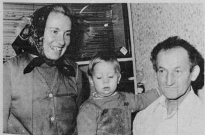
Srečni smo takole skupaj, sta zatrjevala Meškova.

primernejše pa je, da oddamo otroke že pred sedmim letom starosti. Trenutno je iz naše občine v rejništvu 125 otrok. Za popolno oskrbo daje socialno