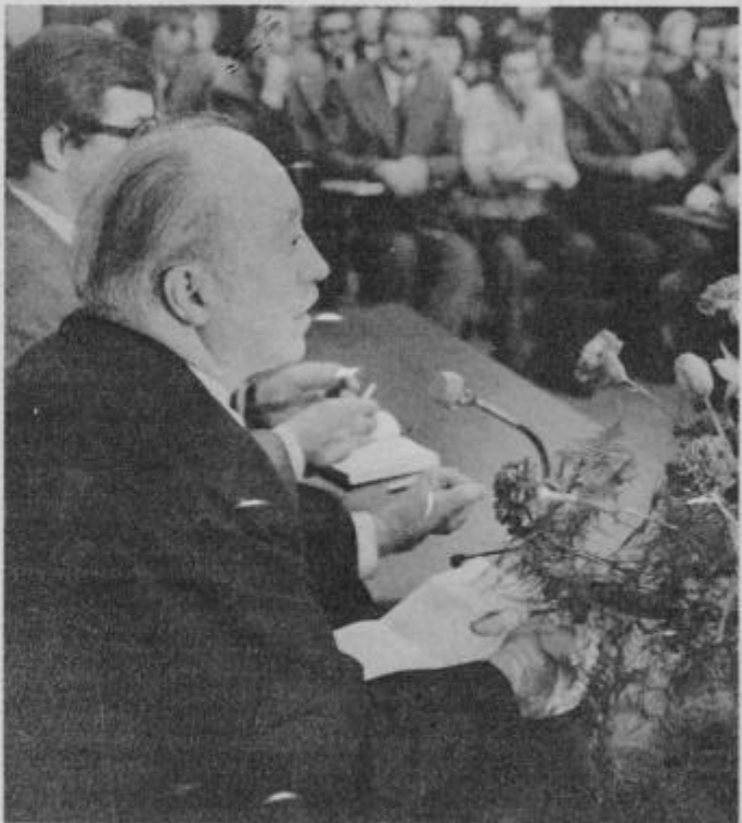
Mitja Ribičič v razgovoru z bistrškimi občani, 8. januarja 1977

Opravljal je še vrsto vse odgovornejših in pomembnejših dolžnosti, vojaških in političnih. Predvsem velja poudariti njegovo pionirsko delo na področju kulturnoprosvetne dejavnosti v NOB. Posvetil se je