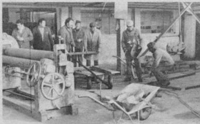
Sedanji proizvodni prostori