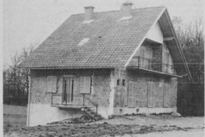
Takšen je sedaj lovski dom v Veliki Nedelji.