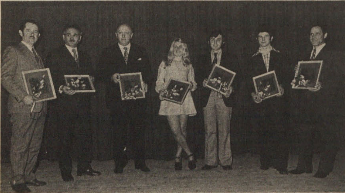
Ob zaključku revije amaterskih gledaliških skupin so se na Dobrovi predstavili občinstvu vodje sodelujočih skupin.

V počastitev dneva mladosti je občinska zveza kulturno prosvetnih organizacij organizirala srečanje mladih pevcev. V sredo 22. maja so se zbranimu občinstvu v Festivalni dvorani predstavili otroški zbori iz osnovnih šol Polhov Gradec, Ig, Bičevje in Brezovica ter mladinski zbori osnovnih šol Bičevje, Vrhovci, Ig, Trnovo in Brezovica. Naslednji večer pa so partizanske, narodne in otroške pesmi izvenele iz grl otroških zborov osnovnih šol Škofljice, Velikih Lašč, Viča in Oskarja Kovačiča ter mladinskih zborov iz osnovnih šol Škofljica, Horjul, Vič, Oskar Kovačič in Velikih Lašč.