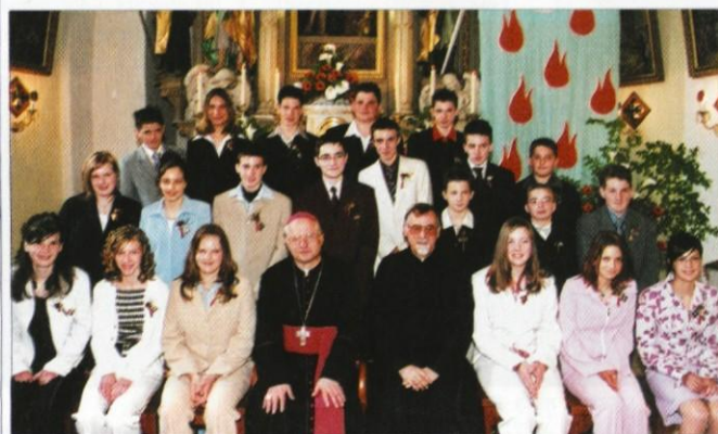
Letošnji birmanci v Krašnji

Slabe tretjine še ni obiskal abraham, nekatere je že, k ostalim pride še letos. V dobrih dveh urah smo se nakapljali h Kovaču, se prepoznali, trepljali po hrbtih in klepetali, da se je kmalu začelo zares bliskati.