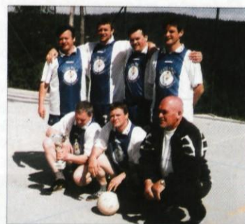
Uspešna Veteranska ekipa Zlatega Polja