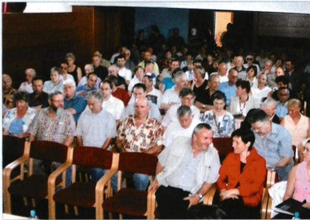
Zbor krajanov - Šentvid

Polemika je bila dolga, obsežna in zanimiva. Ker menim, da na koncu nismo povzeli vseh zaključkov razprave, sem se odločila, da jih skušam strniti in vam jih posredovati v pisni obliki. Moram priznati, da tak način komuniciranja uporabljam prvič, vendar se kot krajanka v tem primeru čutim dolžno, da to storim.