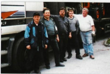
Skupinska slika pred odbodom iz Lukovice