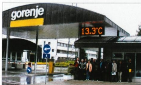
Društvo inovatorjev v Gorenju