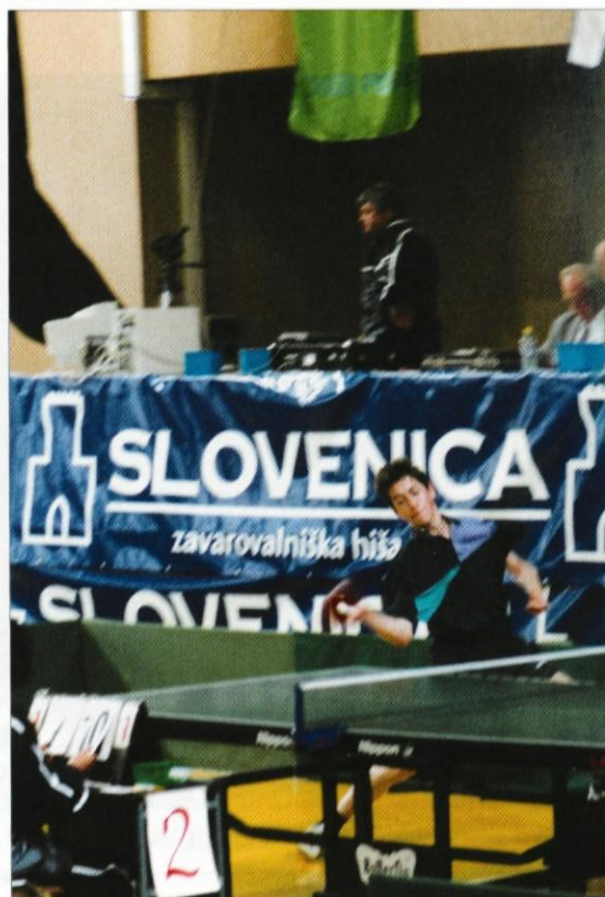
Državno prvenstvo za mladince, 5. in 6. maj 2001