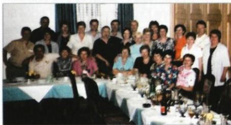
Letnik 1954 in 1955 smo se srečali zopet po 35 letih

Gledam gor in dol po dolgem omizju, na enem koncu tiščijo glave skupaj, na drugem sem mislila, da igrajo tarok, pa so le izmenjavali fotografije in kazali svoje vnuke drug drugemu, kajti o naših otrocih smo se pogovorili že pred leti.