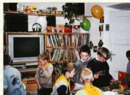
Vrvež med knjigami

Prav kmalu bo minilo leto dni, odkar je odprla vrata knjižnica dr. Jakoba Zupana v Šentvidu pri Lukovici. Police se vztrajno polnijo z novim gradivom in bralci vestno skrbijo za njihovo prevetritev. Knjižnica se je lepo vpela v prijetno okolje in s tem izpolnjuje svoje temeljno poslanstvo širjenja bralne kulture in informacijskega opismenjevanja na podeželju. Znanje, informacije in kulturne vrednote pomembno dvigujejo izobrazbeno strukturo občanov, zato si želimo, da bi se obisk še naprej povečeval. Knjižnica v Šentvidu je organizacijska enota Knjižnice Domžale in zato seveda ni in ne more biti tako bogato založena, a kljub temu poskušamo ustreči Vašim željam, predvsem s kroženjem gradiva in sodelovanjem tudi z drugimi organizacijskimi enotami Knjižnice Domžale. V veliko veselje nam je tudi, da vas še naprej obiskuje Potujoča knjižnica, čeprav je bilo ukinjenih kar nekaj postaj, vendar pri tej odločitvi sama knjižnica ni imela vpliva. V upanju, da se bomo vedno bolj pogosto srečevali in skupaj skrbeli za višjo kvaliteto življenja vas lepo pozdravljam in vam želim sladko in prijetno poletje.