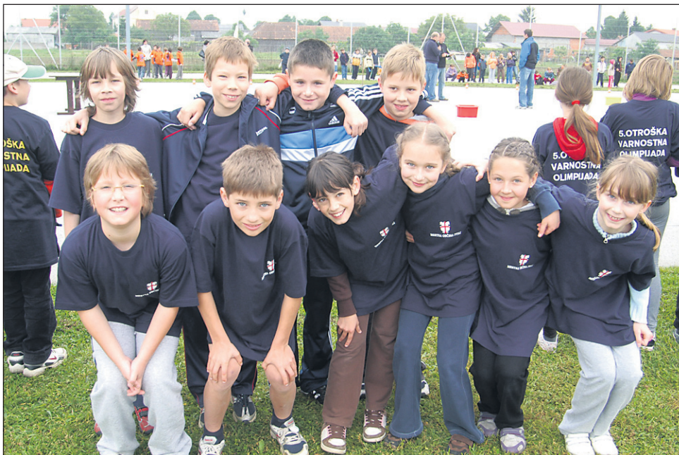
Veseli obrazi zmagovalne ekipe učencev 4. c-razreda iz Osnovne šole Ljudski vrt v Ptuj

Namen projekta Policijske uprave Maribor je, da otroci oziroma šolarji skozi igro in s skupinskim delom spoznajo nekatere najpogostejše elemente nevarnosti. Naučijo