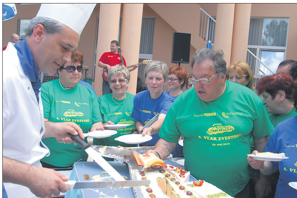
Po obilnem kosilu smo za desert v hipu snedli še skoraj 2,5 m velikega sladnega delfina, še dobro, da je bil narejen iz biskvita in kreme.