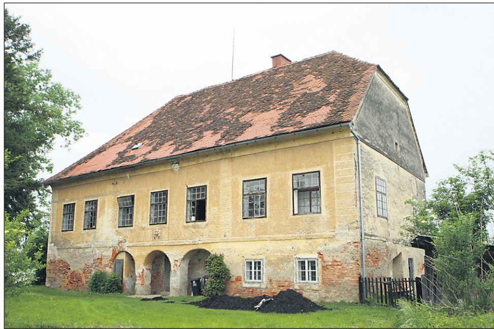
Ristovec je bil večino svojega obstoja z manjšimi presledki priključen gosposčini Gornji Ptuj.

Med starejšimi krajanje je nekdanja podoba dvorca še zelo živa. Nekoč je do njega vodil drevored od zidanih stebrov in oboka, ki so stali na začetku Belšakove ulici pri kapeli ob zdajšnjem krožišču na Ormoški cesti, pa vse do samega vhoda v dvorec. Na svetu ČS Jezero so o drevoredu razpravljali na eni prejšnjih sej sveta, ker ga želijo obnoviti. Eno od ptujskih podjetij namreč želi urediti drevored nekje na območju MO Ptuj, lokacija zanj pa še ni znana. Na informacijo o tej ponudbi so se v ČS Jezero takoj odzvali in ponudili, da se ta drevored uredi na območju