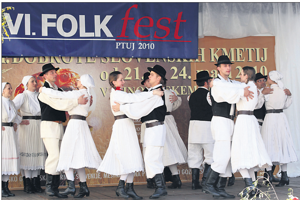
Folklorna skupina KUD Djurmanec je v prvem spletu nastopila s plesi severnega dela Zagorja.