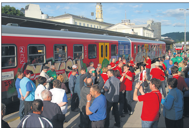
V nekajminutnem postanku v prestolnici smo zasedli ves peron in nekateri so od sonca in sreče celo zaplesali.