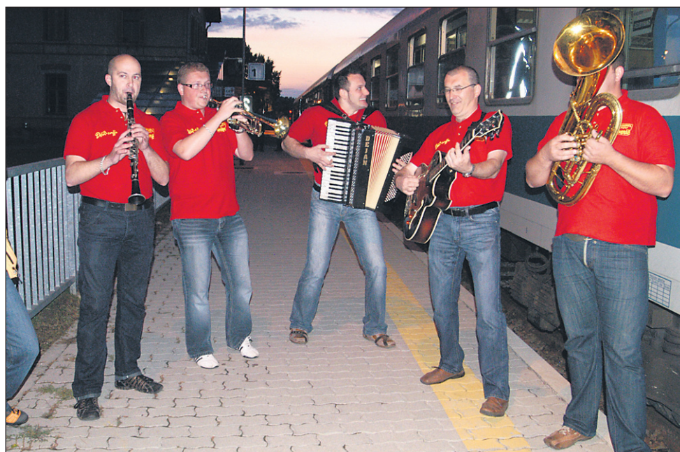
Člani Ansambla bratov Gašperič so zavižali že kar na ptujskem peronu in pred odhodom vlaka dali vedeti, da na njem ne bo prostora za slabo voljo.

Luke Koper, druga polovica pa jo je kar peš mahnila na ogled bližnje kleti Vina Koper.