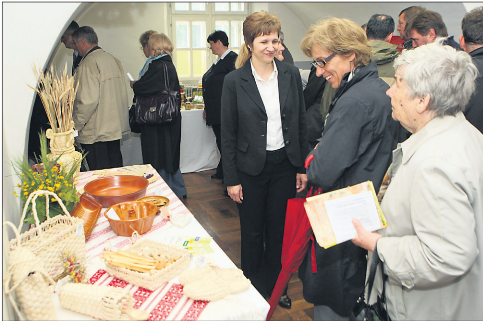
Osrednja pokrajina na letošnji razstavi je bilo Pomurje.

države. Vedno več je tistih, ki povprašujejo po domači hrani. Slovensko podeželje se lahko pohvali z bogato tradicijo in pestrostjo izdelave pokrajinsko značilnih kulinarčnih dobrot. Slovenija bo še naprej spodbujala prodajo izdelkov s kmetij, prav tako pa tudi z razpisi iz programa razvoja podeželja spodbujala tovrstno proizvodnjo. Razstava Dobrote slovenskih kmetij spodbuja razvoj slovenskega podeželja, saj kmetijam omogoča dodatno dejavnost, slovenskemu potrošniku pa hrano vrhunske kakovosti in