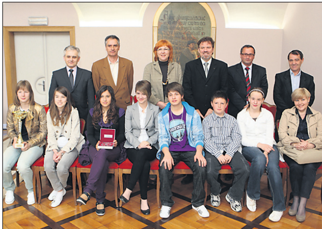
Ekipo prve pomoči OŠ Breg je uspelo ponoviti lanskoletni uspeh in ubraniti naslov državnega prvaka.