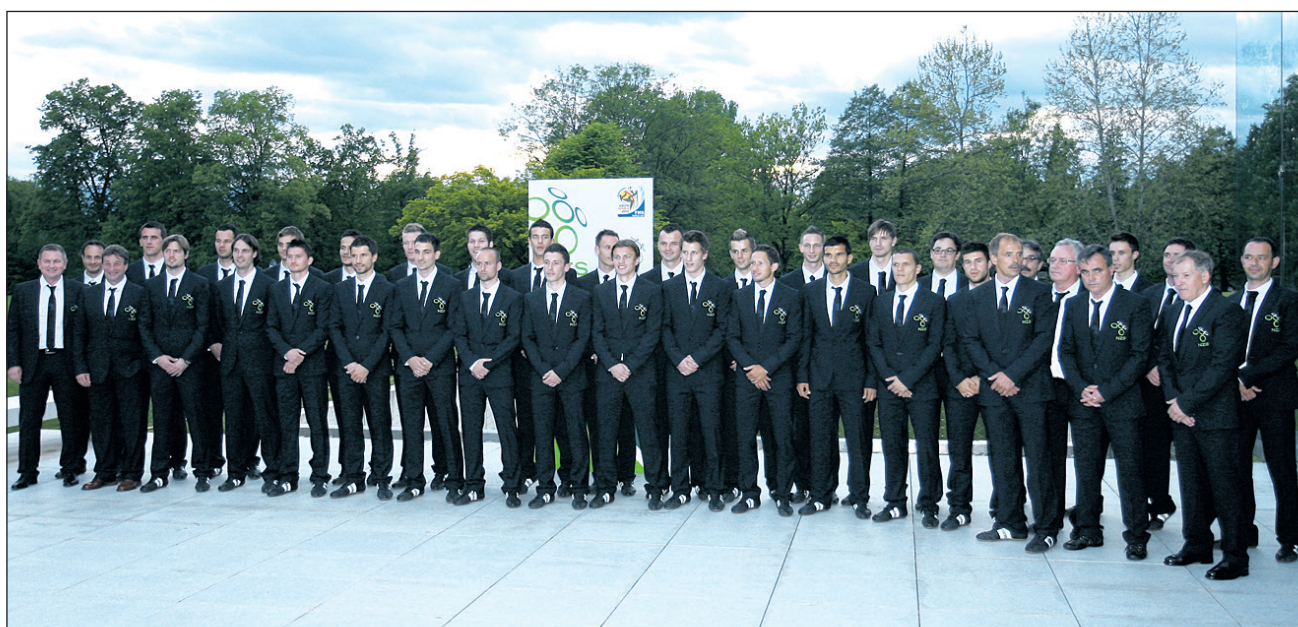
Slovenski reprezentantje so se v novih uradnih oblačilih odlično počutili.