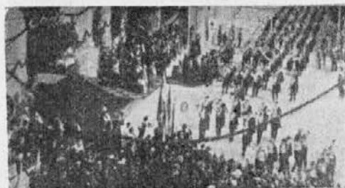
Češkoslovaški Orli v sprevedu v Ljubljani 1913.

na drugi strani veliko reprodukcijo plakata, ki ga je bila za ta tabor izdala Zveza fantovskih odsekov. Ob plakatu pa je z velikimi črkami napisano sledeče: V Ljubljano vabi vas vse jugoslovansko orlovstvo, združeno v Zvezi fantovskih od-