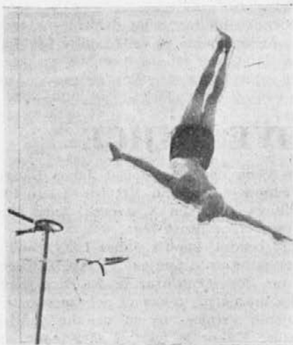
Varšek: Salto s krogov.

ljenih z dinamitom. Izgnanih in večinoma pomorjenih je bilo 40 tisoč cerkvenih služabnikov. Drugi viri vedo povedati, da so bile splošne žrtve boljševiškega režima tele: pomorjenih je bilo 3 milijone. Od lakote jih je umrlo 12 milijonov. V raznih koncentracijskih taboriščih jih je do 6 in pol milijona za-