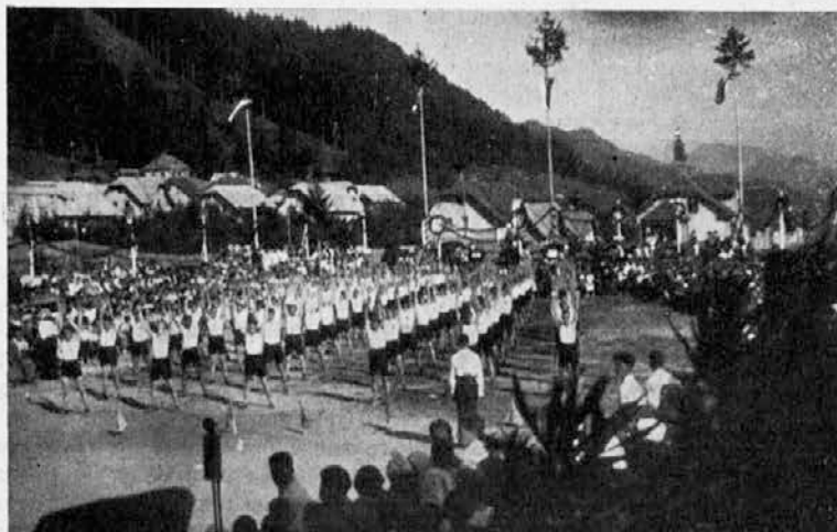
I. nastop fantovskega odseka na Jesenicah 1936.

Veliko mednarodno letalsko razstavo pripravljajo v Beogradu. Pravijo, da takšne še nikjer v Evropi ni bilo. Na nji bodo razstavile svoja najmodernejša letala Nemčija, Italija, Francoska, Poljska, Češkoslovaška, Angleska, USA, Madžarska in naša država. Razstavljenih bo 54 letal, ki bodo predstavljala prav zadnje novosti v letalski industriji. Poštno ministrstvo bo ob času te velike letalske razstave izdalo tudi posebne pošne