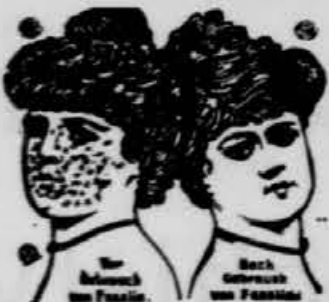
Na milijone dam

„Feolin“ Vprašajte Vašega zdravnika, ako ni „Feolin“ najboljši kozmetik za kožo, lasi in zobe. Najgrši obraz in najostudnejše roke zadobe takoi aristokratsko finost in obliko z rabo „Feolina“. „Feolin“ e langlesko mlo sestavljeno iz 42 zlahitnih in svežih ediš. Jamčimo, da se s porabo „Feolina“ popolnoma olpravijo gube na obrazu, kožni črvi, ogorenja, rudeče na nosu itd. „Feolin“ je najboljšo sredstvo za čiščenje in vzdrževanje in olepanje lasi, zabranjenje iste proti odpadanju, plešami in boleznim v glavo. „Feolin“ je tudi najnaravnejše in najboljšo sredstvo čiščenje vzdrževanje in olepanje lasij, zabranjenje iste proti odpadanju, plešami in boleznim v glavi. „Feolin“ je tudi najnaravnejše in najboljšo sredstvo za za čiščenje zob. Kdor redno rabi „Feolin“ mesto mila, ostane mlad in lep. Vrne se takoi denar, aka bi „Feolin“ ne imel popolnega vspeha. Cena komadv 1 K 3 komadi 2 50 K, 6 komadov 4 K 12 komado 7 K. Poštnica za 1 komad 20 st. od 3 nadalje 60 st. Povzetje 60 st. več. Glavna zaloga M. Feith, Dunaj VII., Mariahilferstrasse 38. I. nadstr.