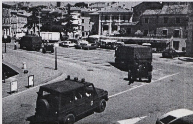
... potem so prišla vojaška vozila in bemvejci tajnih služb ...