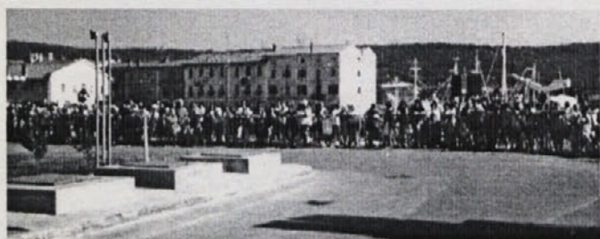
... potem so prišli firbci in obrambno zavedni državljani ...