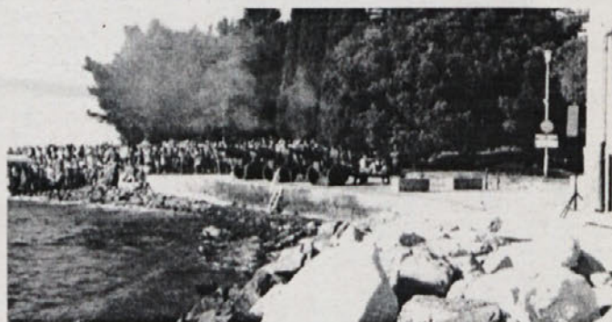
... potem so počili še štirje topovi....