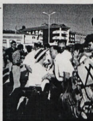
... potem je botra razbila šampanjec, sledili so pozdravi in veselica do večera (ops. do večerje), potem so šli, mi pa smo ostali v mestu z nasmehom...