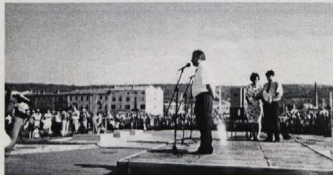
... potem je nekaj močnih na račun premajhnega morja za vse apetite povedal naš župan...