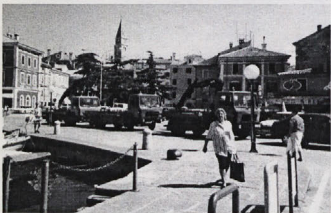
Najprej so prišli trije pajki in izpraznili Veliki trg...