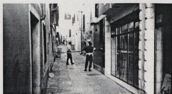
...vojna policija je poskrbela za red...