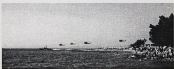
... potem so priletela letala in helikopterji in priplul Ankaran ...