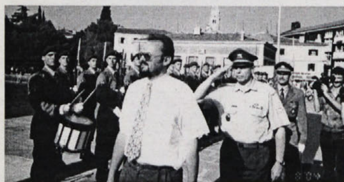
... potem je prišel g.minister in vsi so ga pozdravljali ...