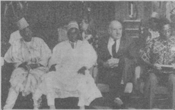
Med prijateljskim in uradnim obiskom v Jugoslaviji je nigerijski predsednik Alhadži Šehu Šagari obiskal Emono. Nigerija daje v zadnjem času izrazit poudarek razvoju kmetijstva, Emona pa se pripravlja, da bo v Nigeriji zgradila veliko farmo za rejo prašičev.