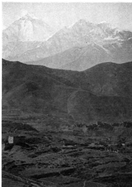
Daulagiri in Tukuče nad tipično tibetansko vasico

Vreme je bilo v prvih dneh (kot tudi pozneje) zelo enolično. Ko smo zjutraj lezli iz spalnih vreč, je bilo nebo jasno. Popoldne se je pooblačilo, začelo se snežiti in zapadlo je nekaj snega. Ponoči se je znova zjasnilo. Tako je svež sneg skoraj vedno zamel naše sledi in zjutraj smo morali gaziti znova. Brž sem tudi ugotovil, da so časi za vzpone v Himalaji močno nesorazmerni s hojo navzdol, in sicer v dosti večji meri kot v drugih gorah. Po poti, ki smo jo opravili v štirih urah vzpona, smo zlahka sestopili v pol ure. Opazil sem tudi, da se višina med 5 in 6 tisoč metri ne občuti posebno in da mi pomanj-