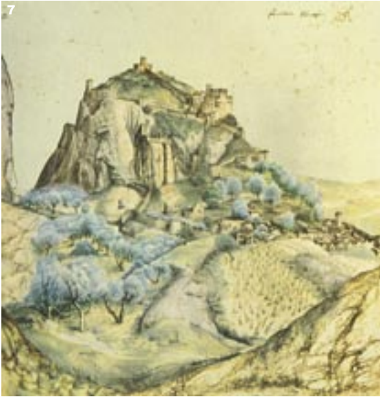
7.) Albrecht Dürer: Arco. Rjavo črnilo, akvarel in gvaš. Louvre.