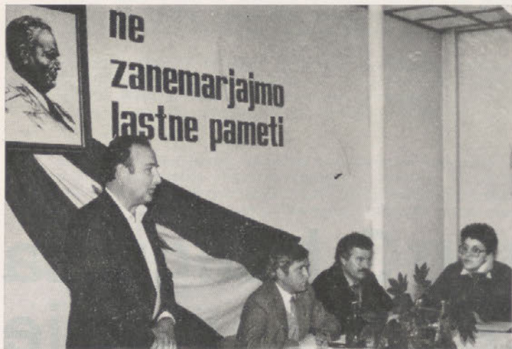
Geslo naj nam postane usmeritev

Dne 30. marca je bilo v prostorih TOZD Tovarne krmil posvetovanje inovatorjev občine Ptuj. Posvetovanje je organizirala SIS za raziskovalno dejavnost SO Ptuj.