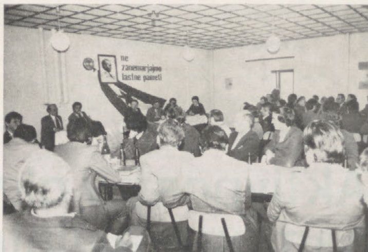
V TOZD Tovarna krmil so se zbrali inovatorji in drugi gostje

Glede na povzetek iz razprave, ugotavljamo, da smo v naši DO zares na začetku in da bomo mo-