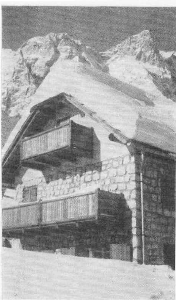
Novi Frischaufov dom na Okrešlju obnovljen v letih 1939—1961