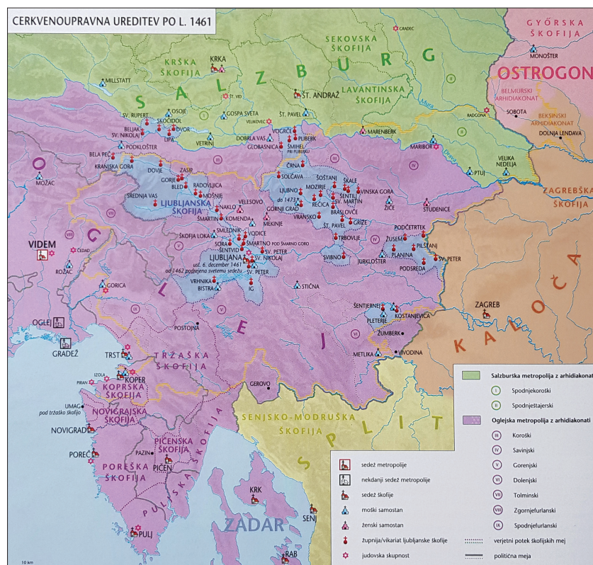
Cerkvenoupravna ureditev po letu 1461 (Slovenski zgodovinski atlas, str. 100).

skega škofa in menzi ljubljanskega stolnega kapitlja, vrsta župnij kostanjeviški in stiški cisterci, nekatere leta 1493 ustanovljenemu kolegiatnemu kapitolju v Novem mestu, v Beli krajini pa je nemški viteški red oblikoval lasten manjši arhidiakonati. 9 Na terenu je torej vladala precejšnja zmeda, med omenjenima opatom in novomeškimi prosti je nenehno prihajalo do sporov, zato je bilo treba razmerje med arhidiakonati nujno vzpostaviti na novo. 10 Po dolgoletnih sporih sta bila konec 17. stoletja vendarle ustanovljena kostanjeviški in stiški arhidiakonati. 11 Veliko večji problem so pomenile zahteve novomeških proštov. Ti so si, potem ko so postali dolenski arhidiakoni, pričeli laštiti določene pravice do župnij obeh samostanov. Želeli so si namreč vso duhovno oblast nad samostanskimi župnijami in njihovo župnijsko duhovščino, razen seveda tiste, ki je pripadala krajevemu škofu. Večji spori med obema samostanoma in novomeškimi prosti so izbruhnili v začetku 17. sto-