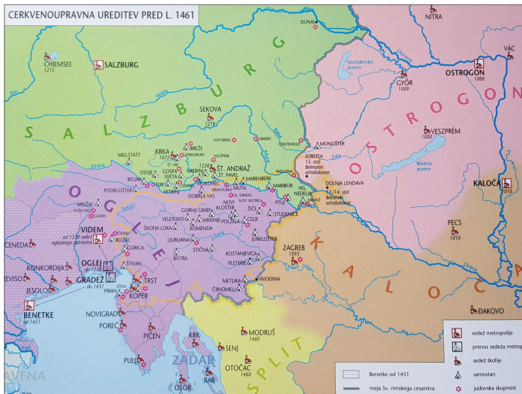
Cerkvenoupravna ureditev pred letom 1461 (Slovenski zgodovinski atlas, str. 82).