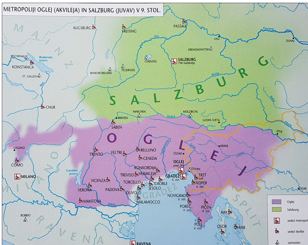
Metropoliji Oglej in Salzburg v 9. stoletju (Slovenski zgodovinski atlas, str. 56).