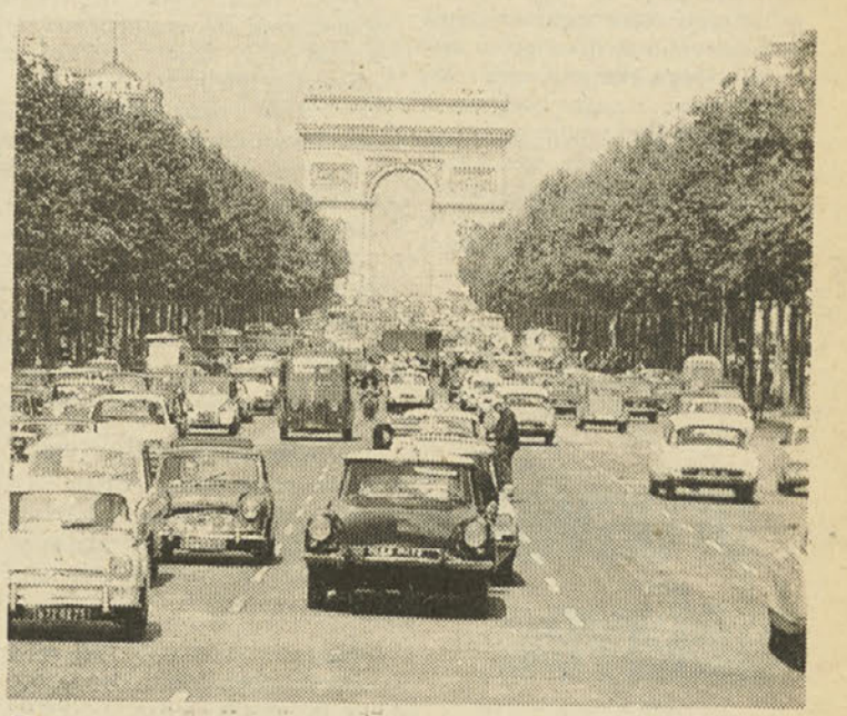
Poslovni promet na eni najlepših avnij na svetu, na Elizejskih poljanah, s Slavolokom zmage v ozadju.

Potem sva se srečevala: na avtobusni postaji, na tržnici, na ulici... Zmeraj sva pritrčno poklepetala kot stara prijatelja, o vsem sem bila na tekočem: oče je umrl... mama bo morala na operacijo... šolo sem končal... kar dobro službo imam... poročil sem se... imam hčer... počitniško hišico zidamo... Pravzaprav normalna življenjska pot, bi rekli. Zmeraj bolj pa me je motilo, da ga življenje na zunaj ni s spremenilo. Imel je enako smehljivo se oči, usta, ponižno držo, kot da ga sprašujem za oceno. Bilo mi je neprijetno zaradi te njegove ponižnosti, rada bi mu rekla, naj se vendar vzravna, saj je že za glavo višji od mene, lahko je ponosen na svojo prehojeno pot, pred njim je prihodnost, zdaj sva vendar oba odrasla človeka. Pa mu tega ni-