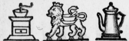
Tovarn. znamka. Tovarn. znamka. Tovarn. znamka.

da imate jamstvo za vedno jednako in najboljšo kakovost. — Pazite pri tem na varstvene znamke in podpis, kajti naše zamotanje se v enakih barvah, papirju in z podobnim natisom ponareja. —