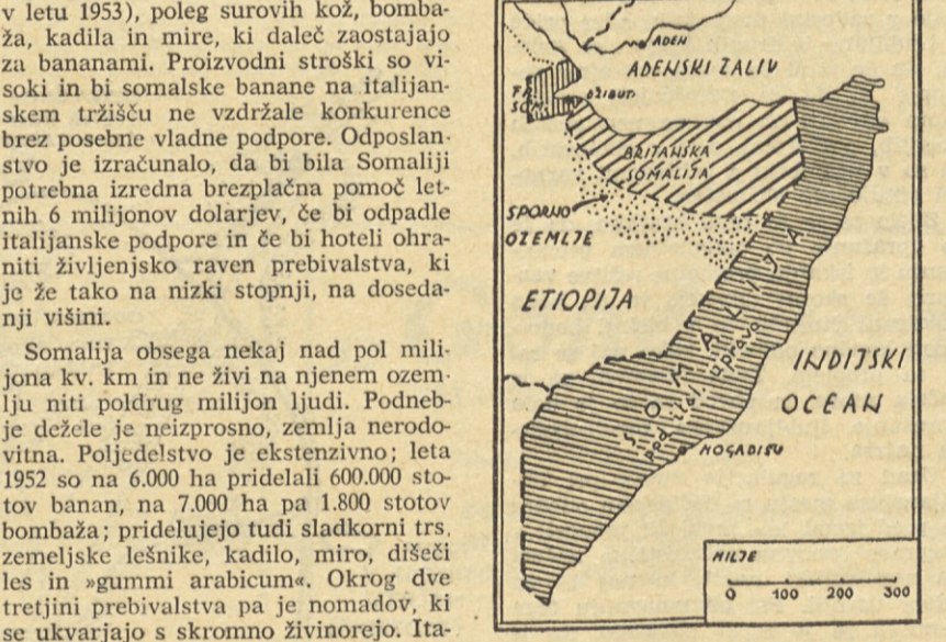
Somalija obsega nekaj nad pol milijona kv. km in ne živi na njenem ozemlju...