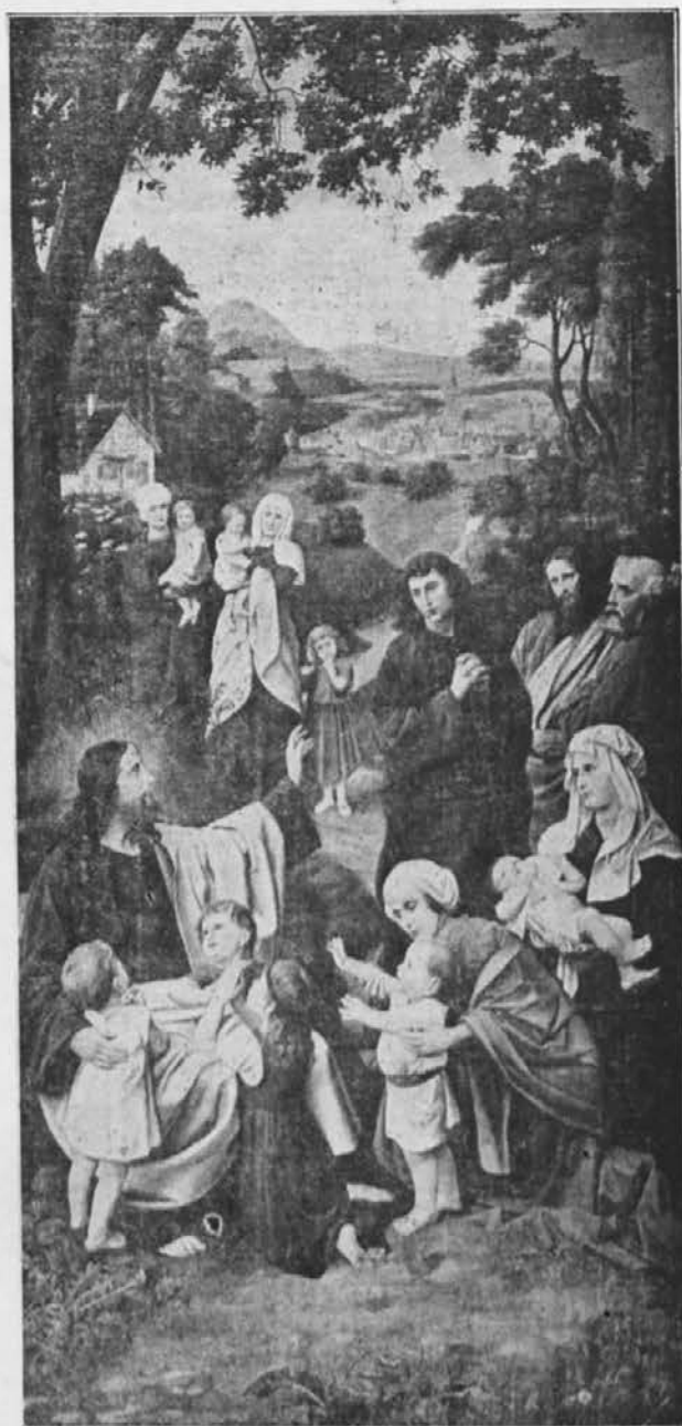
Prijatelj otrok. —

Kako plemenit, kako duhovit je bil obraz priprostega ribiča iz Galileje! Natančno je razložil Samuel njegove besede: