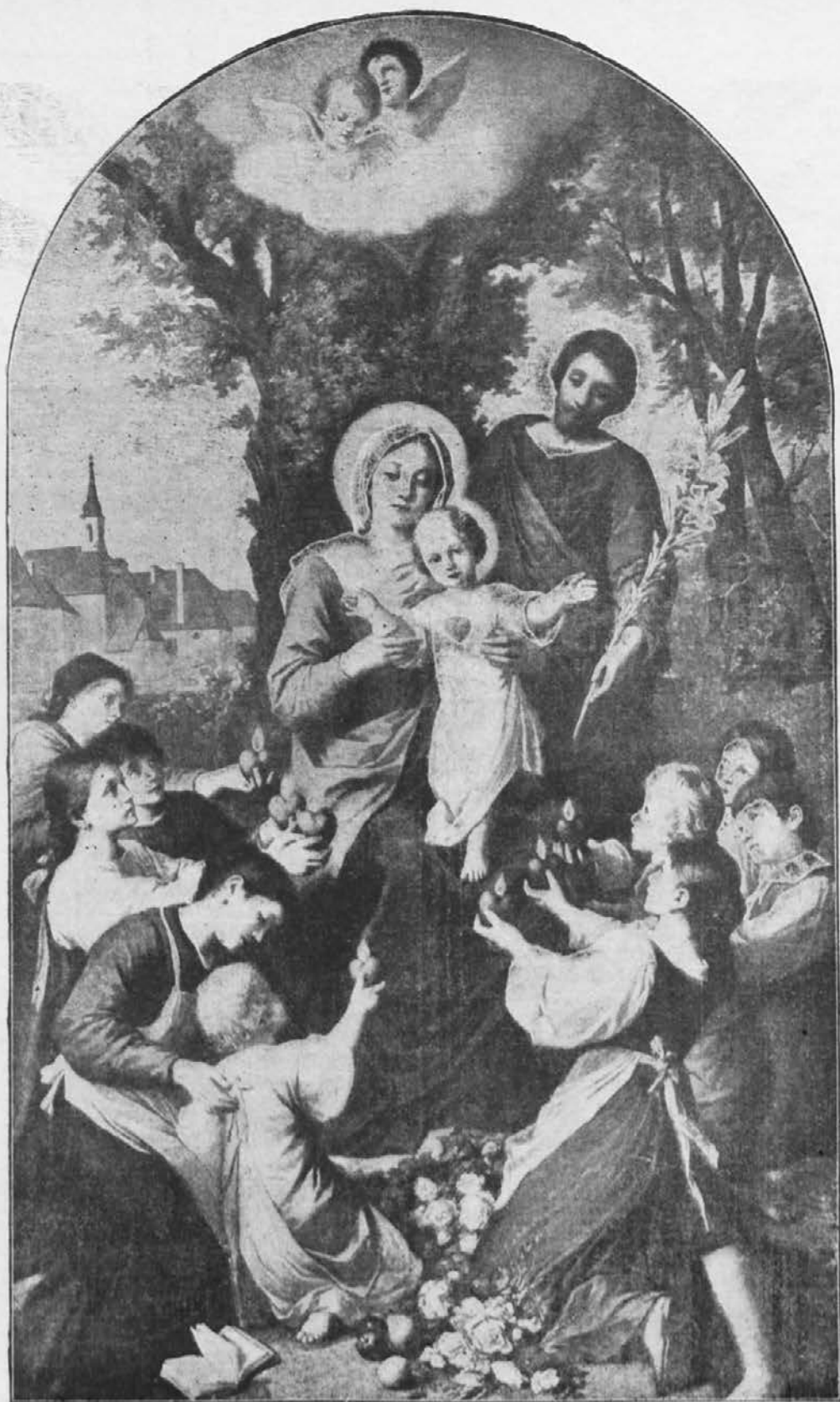
Srce ji daj!