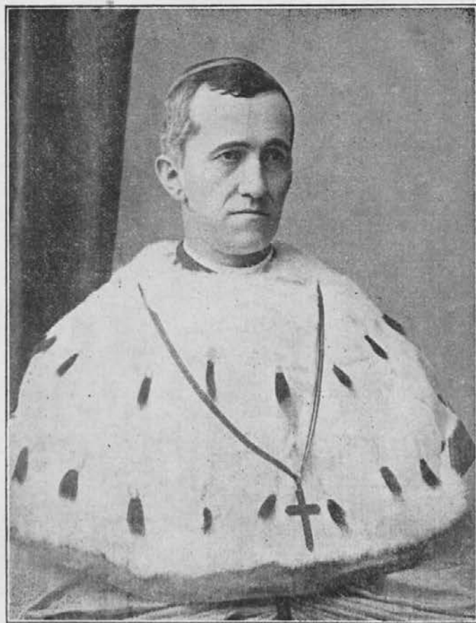
Dr. Anton Bonaventura Jeglič, knez in škof Ljubljanski, vodja jugoslovanskega gibanja.

Mi se za to nismo zmenili, ker smo vedeli, do to ni nikak "klerikalizem", da je to samo potvara resnice od strani naših nasprotnikov, ki so našli svoje bratce tudi tukaj v Ameriki, da so razširjali tedaj gnjili in danes že mrtvi liberalizem. Mi