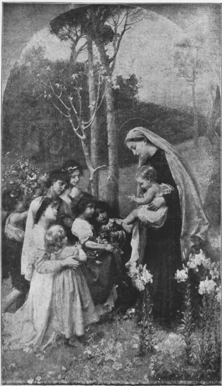
Daj ji cvetja, Kraljici maja!