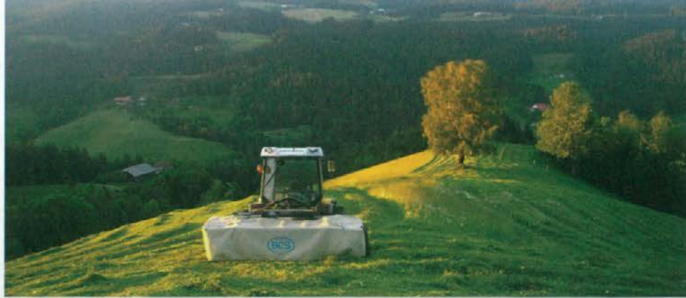
Kjer ni prestrmo, lahko delajo s traktorjem.