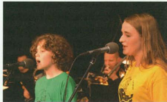
Škoda, da se na sliki zvok ne sliši.