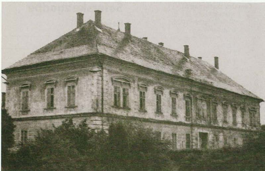
V tej stavbi se je začela zgodovina slovenjgraške ekonomske srednje šole.