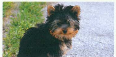
Se res smeji?

Kljub redni higieni pa je včasih potrebno profesionalno čiščenje pri veterinarju. Za strokovni pregled in čiščenje je potrebna anestezija, kajti živali za razliko od človeka ne sodelujejo pri