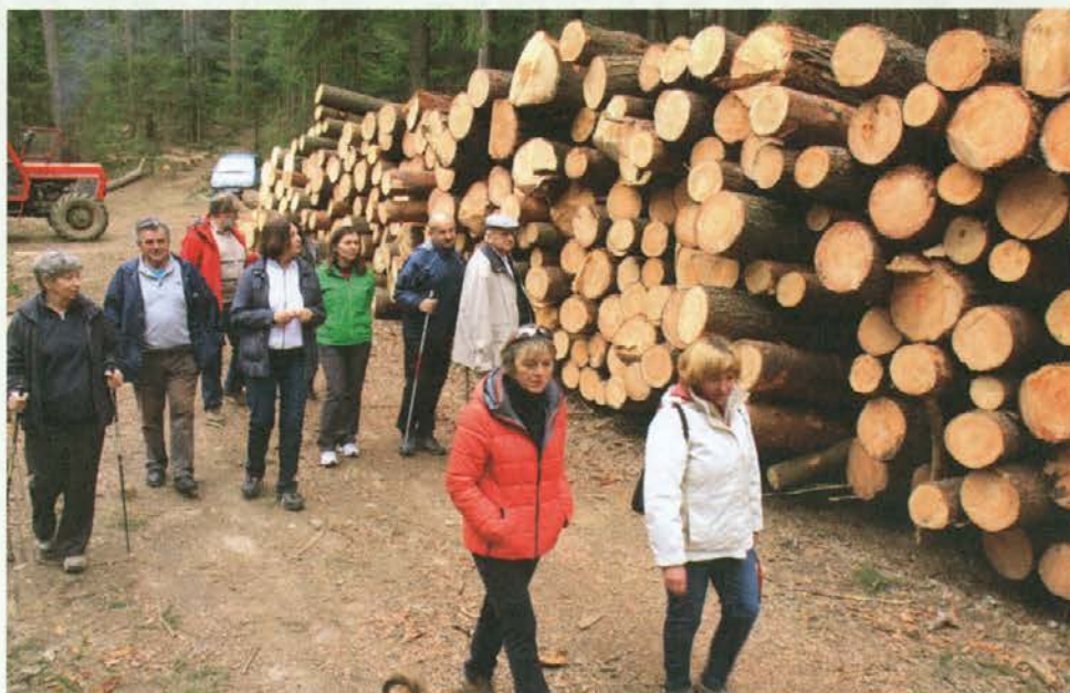
V Dobravi je že veliko narejenega.

Površina vseh poškodovanih gozdov Dobrave na območju od toplarne do letališča pa obsega okrog 300 ha in tukaj je bilo po dosedanjih izmerah poškodovanega okrog 19.000 m 3 lesa.