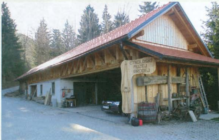
Kmetija je lepo urejena

Približno dva kilometra od kmetije stoji cerkev sv. Marjete. Za kmetijo je Paški Kozjak, pred njo pa se odpira pogled na Pako in Roglo.