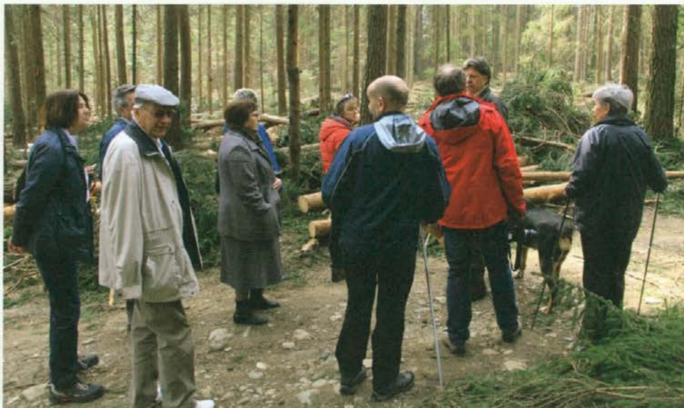
Posledice žledoloma so hude.

V lepem, sončnem dnevu smo se prepričali o moči narave in o resničnih razsežnostih te katastrofe, ki nas je prizadela v začetku februarja. Prav tako smo videli, da je v tem obdobju bilo v Dobravi opravljenega že veliko dela: lastniki skrbno urejajo gozdove, sanacija je v polnem teku, drevje je pripravljeno za spravilo in odvoz. Zaradi intenzivnega opravljanja del in še vedno motene prehodnosti gozdov, predvsem pa zaradi osebne varnosti, priporočamo obiskovalcem, da se tudi v prihodnjih tednih izogibajo gibanju po gozdovih Dobrave, predvsem tam, kjer se opravljajo gozdarska dela.