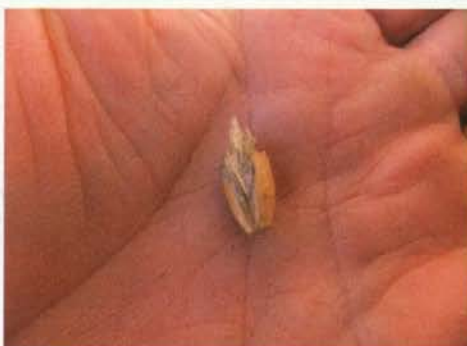
Ogromna energija, shranjena v majhnem semenu.

Stratifikacija ali izpostavljenost semena nizkim temperaturam za določeno obdobje povzroči, da se seme "aktivira" in začne s kalitvijo. Semena določenih vrst namreč vsebujejo hormone, ki zavirajo kalitev. Če so ti hormoni dovolj dolgo izpostavljeni zadosti nizkim temperaturam, razpadejo, in seme začne kaliti. Na ta način je rastlinska vrsta zavarovana pred tem, da bi semena začela kaliti prehitro, npr. sredi zime. Zato morajo semena določenih vrst premrzniti, da se sproži kalitev, medtem ko nekaterim ni treba – odvisno predvsem od tega, od kod ta rastlinska vrsta izvira.