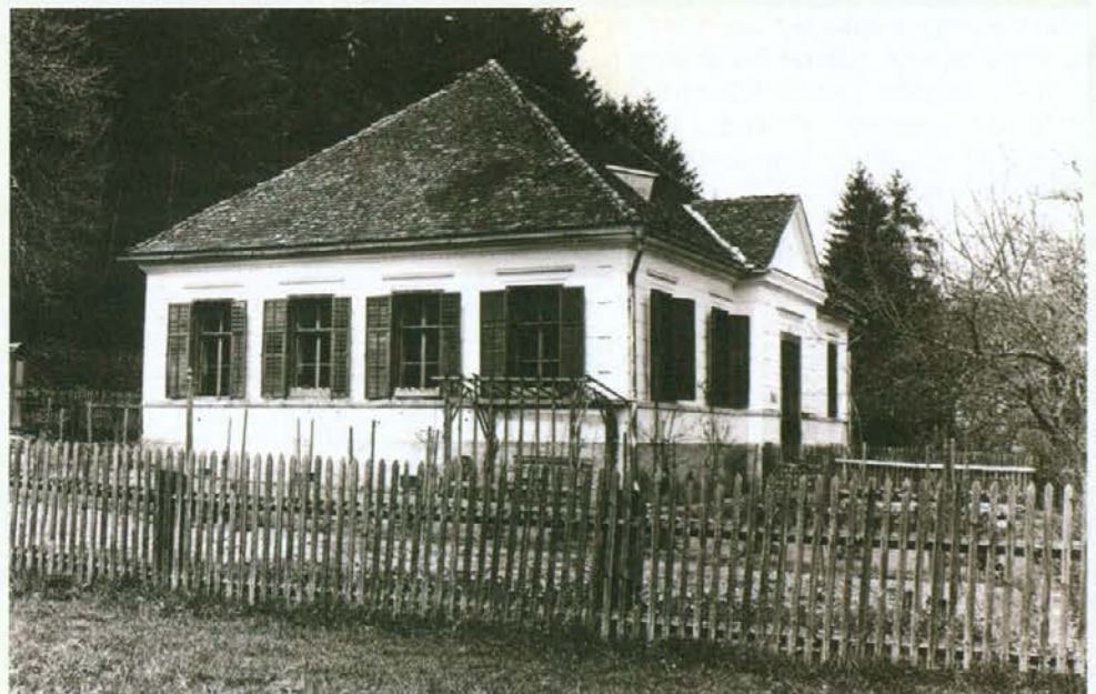
Osnovna šola Sele-Vrhe

Tedaj sem ga videl zadnjič, kajti moja službena pot me je vodila izven Slovenije.