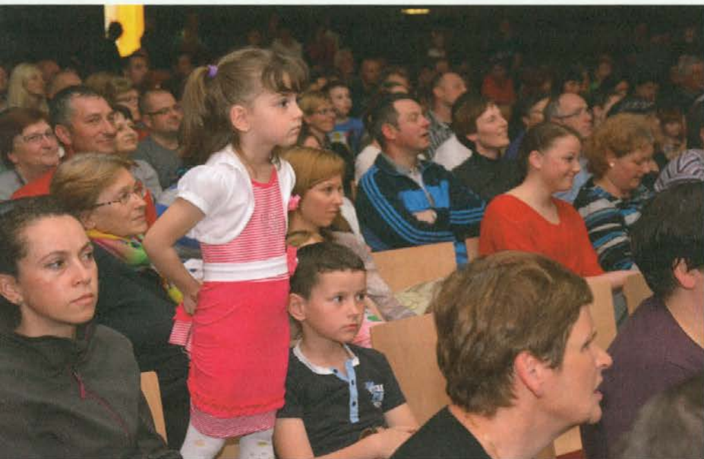
Če si premajhen ...