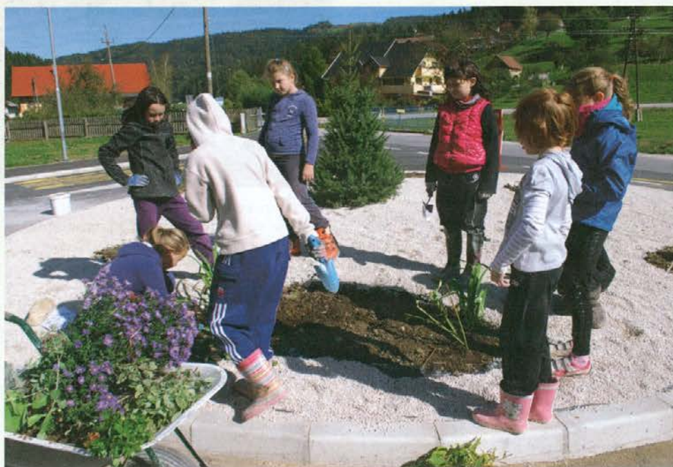
Naš otok ...