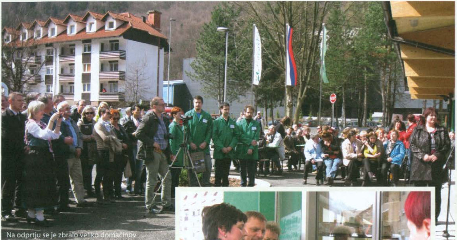
Na odprtju se je zbralo veliko domačinov