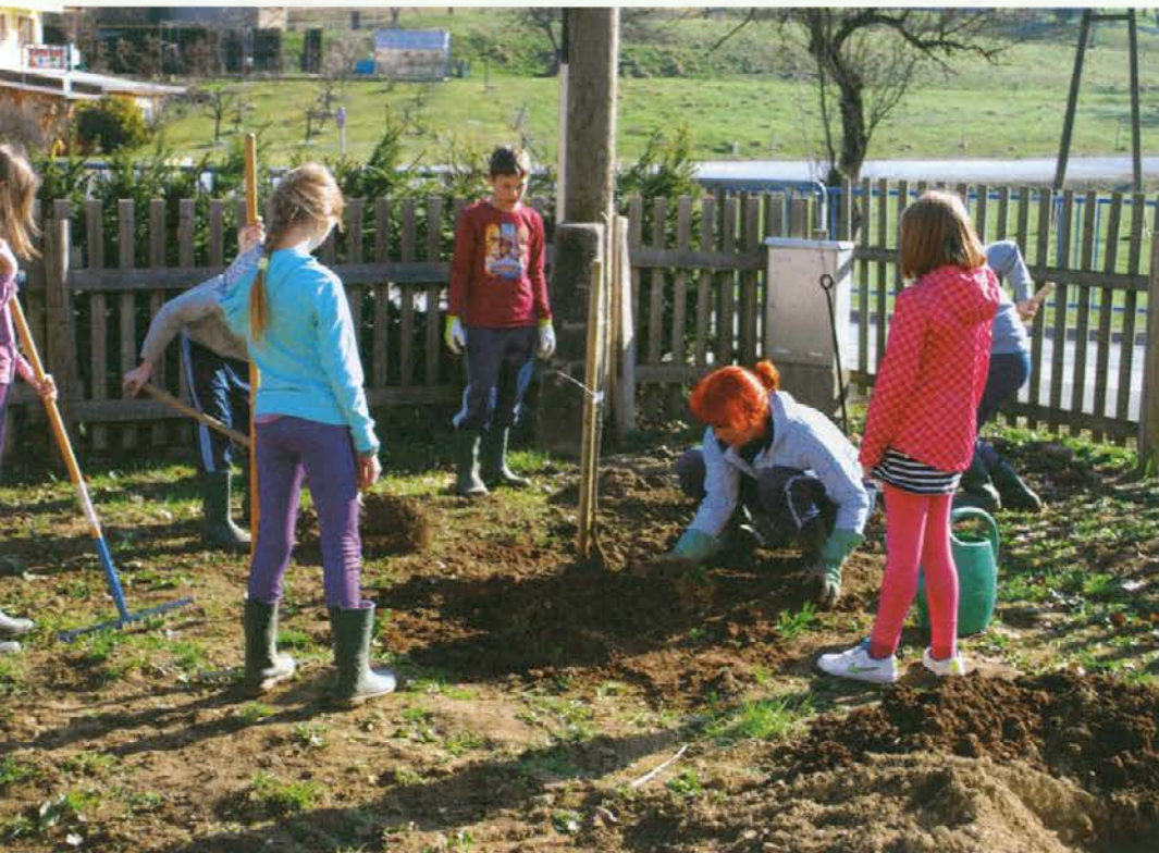
... in naš sadovnjak

Ravno zaradi pozitivnih izkušenj sem se odločila, da je čas za širitev. Vključiti želim še sadovnjak, zelenjavni vrt, nasad malin in okrasni vrt na otoku pred šolo. Ker pa se vzgoja otrok začne že zelo zgodaj, bo seveda svojo gredico dobil tudi vrtec.