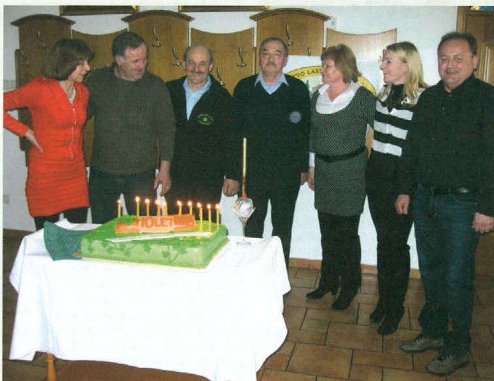
Spominsko sliko smo polepšali z našimi damami iz Gozdarske zadruge, ki z velikim zagonom sodelujejo pri licitaciji in delu društva.

Film na kratko prikaže celoten postopek za izdelavo lesenega kolesa. Najprej je treba pripraviti orodje, drevo podreti, razžagati, posušiti in les dostaviti kolarju. Kolar iz 37 sestavnih delov izdelava kolo, ki ga je treba še okovati. Veseli smo,