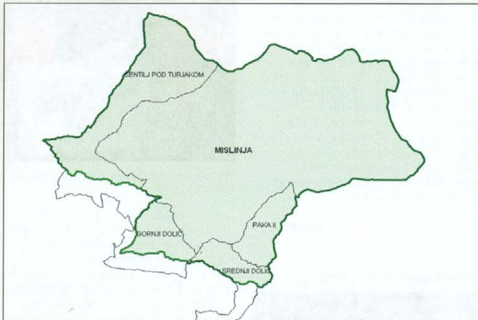
Gozdnogospodarska enota Mislinja

Pobude lahko posredujete v času priprave na obnovo gozdnogospodarskega načrta gozdnogospodarske enote Mislinja od 1. marca