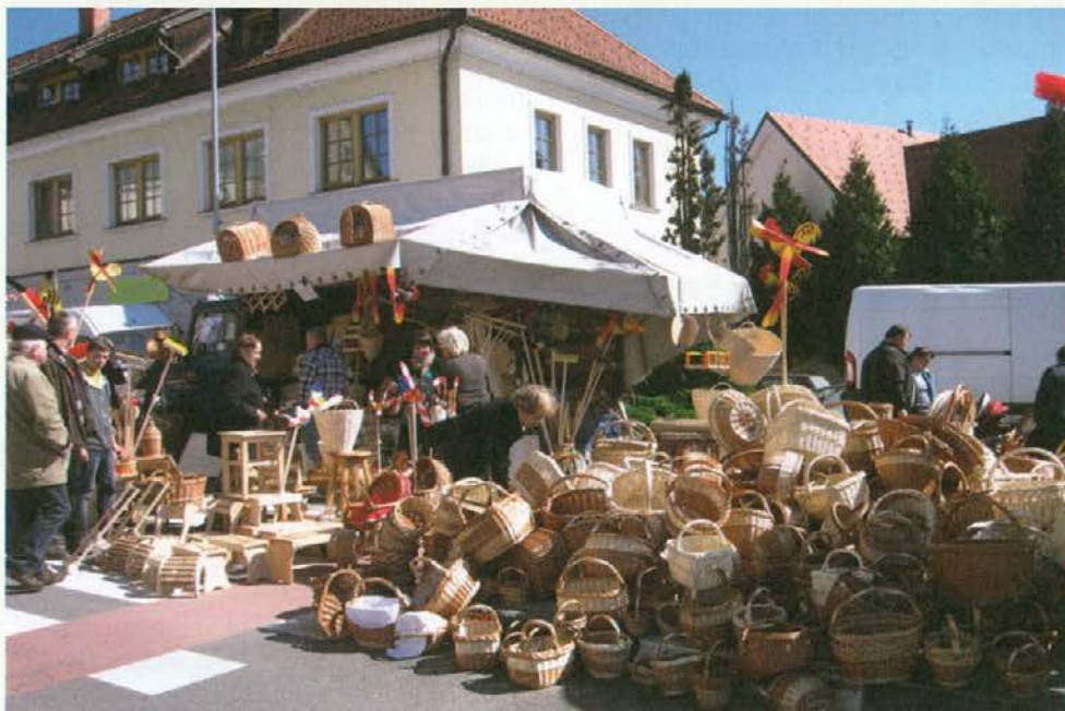
Brez ponudbe izdelkov suhe robe na takšnem sejmu pač ne gre.

Na Jožefovo je v Sloveniji organiziranih še več podobnih sejmov. Zelo znan je sejem v Petrovčah, ki pa je bolj usmerjen v razstavljanje kmetijskega orodja in strojev, zato se ga vsako leto udeležuje tudi veliko kmetov z našega območja.