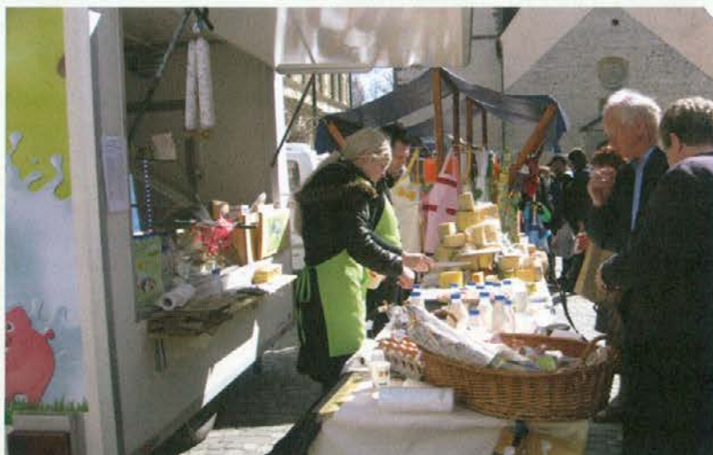
Tudi kmetje iz domačih logov so vse bolj prisotni na sejmu.