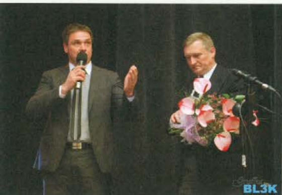
Župan in podžupan sta vsem podarila cvetlice.