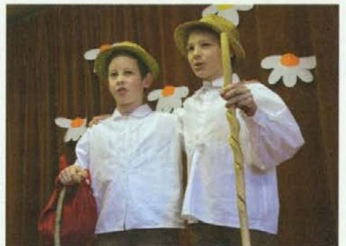
Pastirčka z Leš