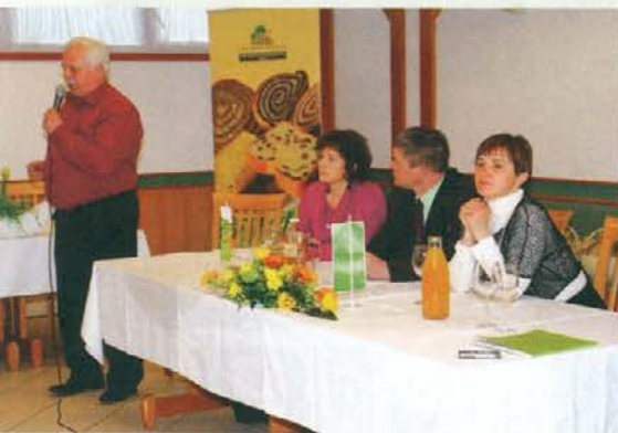
Nagovor predsednika in delovno predsedstvo

Člani Združenja turističnih kmetij Slovenije so se 24. marca 2014 na Letališču pri Slovenj Gradcu zbrali na 16. letnem tradicionalnem srečanju, kjer je obenem potekala tudi 5. volilna skupščina. Izvoljeni so bili novi organi združenja, predsednik pa je ostal isti.