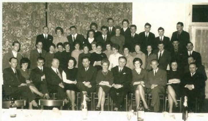
Prva generacija ekonomskih tehnikov, študij ob delu, 1964, sedijo učitelji.