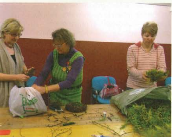
Spretna roka ...

Četrtna skupnost Center, Štibuh in Stari trg-mesto ter Kulturno društvo