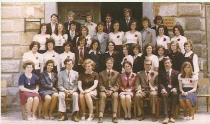
3. b, ena izmed prvih generacij šole za prodajalce, 1973/74, in učiteljski zbor.

šolsko leto smo že vpisali 167 učencev iz 31 trgovskih organizacij iz koroške regije ter celjske in žalske občine."Praktični pouk je potekal pod nadzorstvom strokovnega učitelja oz. ob pedagoškem vodstvu šole. Trgovske organizacije so bile s takšnim sodelovanjem zelo zadovoljne."