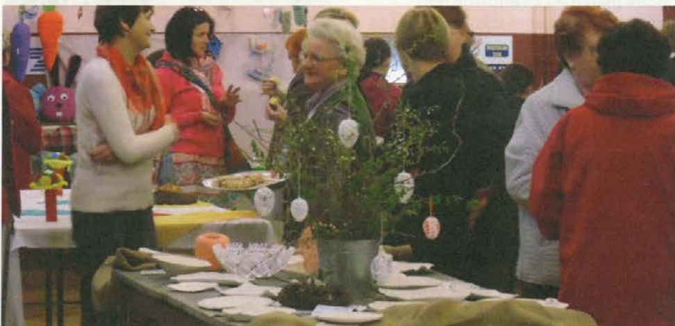
Razstava je bila zelo obiskana.

Stari trg so ob materinskem dnev in dnev žena ponovno organizirale spomladanske delavnice ustvarjanja ročnih del.