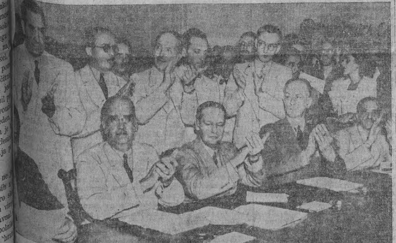
Na sliki vidimo državnike južno- in centralno-ameriških republik, ki aplavdirajo podpisu prijateljske solidarnosti proti osi.