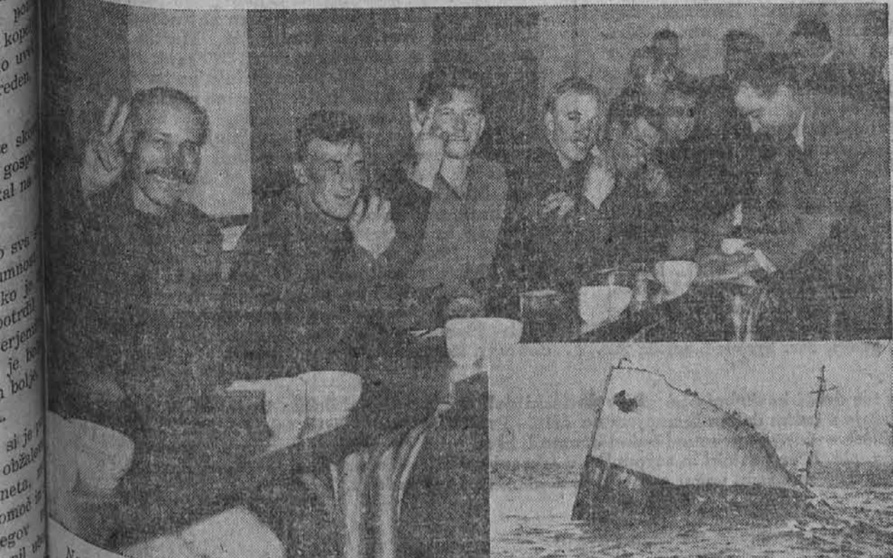
Na sliki vidimo nekatere člane posadke norveškega tovornega parnika Varangerja, ki je bil potopljen in pogreznen ob ameriški obali. Vsa posadka, ki je štela 42 moških, je bila rešena. V spodnji sliki vidimo prednji del parnika Varangerja, v trenutku, preden je izgubil stabilnost.