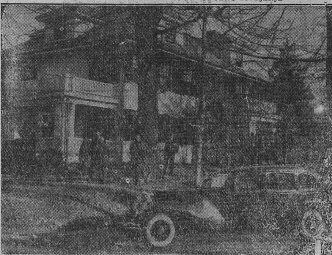
Razkošna hiša v New Rochelle, N. Y., ki jo je dobil v dar vodja nekega nigrovskega verskega kulta, "Father" Divine, od svojih pristašev. Nigri tega svojega voditelja naravnost obožujejo ter ga imenujejo "Boga"; on pa nasprotno naziva svoje ovčice z "Angelčki".

spravil grozdje v klet, preden ga je stehatil v prisotnosti finančnih organov, je bil težko kaznovan.