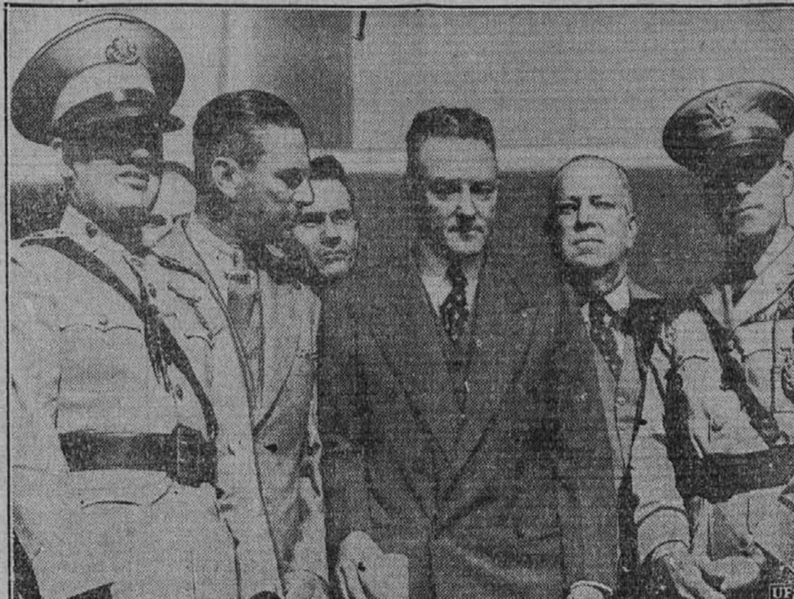
Admiral E. Byrd (v sredi), ko je obiskal prestolico Kube, Havana, na svojem potovanju proti južnemu tečaju. Okrog njega so razne vladne in vojaške kubanske osebnosti.