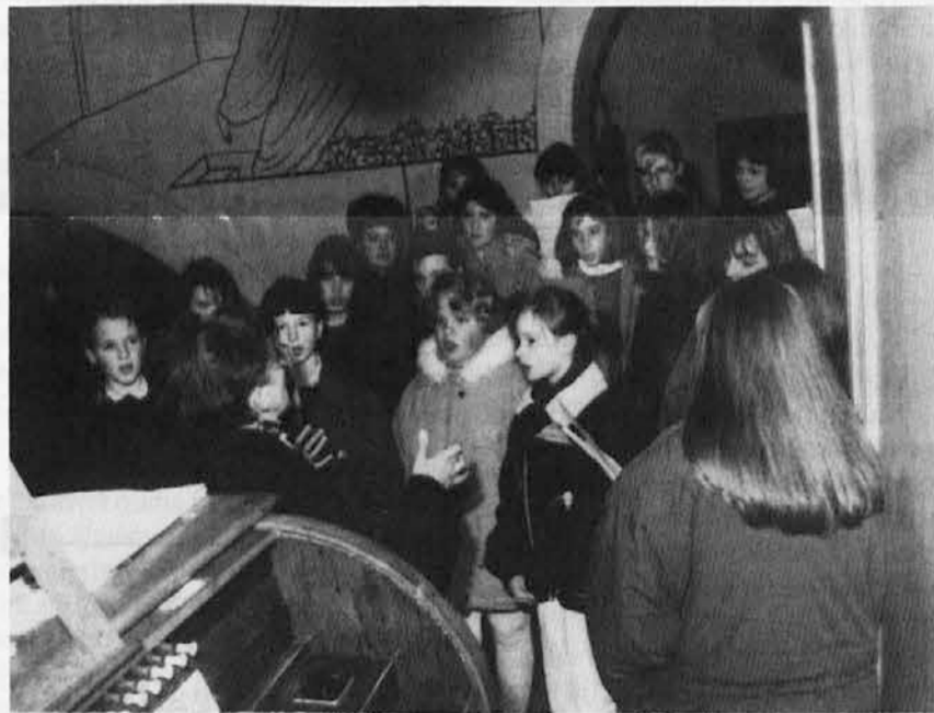
Božičnica na Mirenskem Gradu: dekliški zbor s Kapele