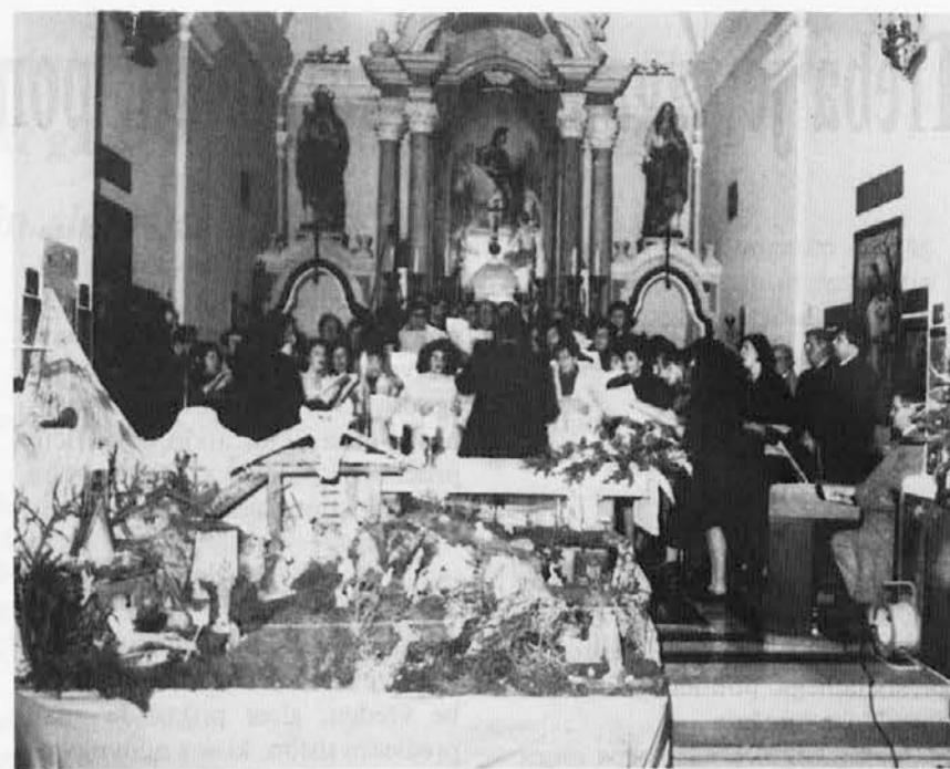
Sovodnjska božičnica: združeni mešani zbor

Sovodnjska božičnica je nato prerasla v skupno srečanje z vsemi značilnostmi prireditve, ki vzradosti, dviga in spodbuja za nove načrte. Cerkevna ladja polna poslušalcev, prezbiterij poln pevcev sta že vsak po svoje prispevala k svečani izrednosti dogodka. Bogastvo božičnih melodij se je nato prepletalo z izbranimi besedami priložnostne duhovne misli in veznim tekstom napovedovalca. Združeno petje je omogočilo izvedbo zahtevnega programa, v katerem so se priljubljene skladbe kar vrstile druga za drugo do mogočnega zaključka z Vrabčevu Bila je noč, za sklepno popotnico pa še Sveta noč,