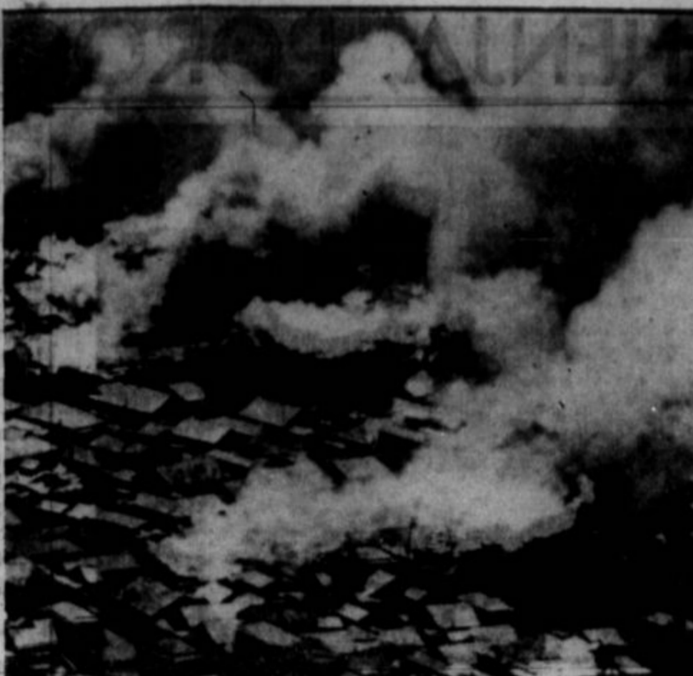
SLIKE, KAKRŠNIH VEČ NE BO. Predstavlja enega izmed poslednjih napadov iz ameriške nosilke letal na japonsko mesto Nemuru.