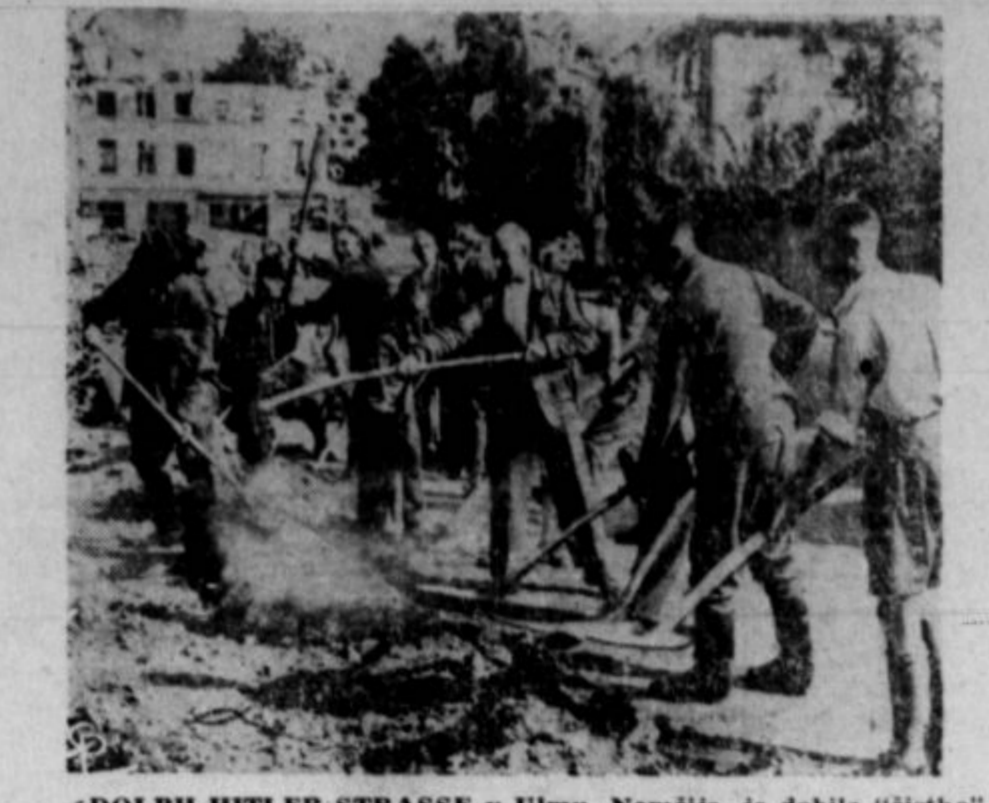
DOLPH HITLER STRASSE v Ulmu, Nemčija, je dobila "čistko". Izvršiti so jo morali nacisti, ki so prej žide in pa zaslužence iz okupiranih dežel pošiljali na taka dela.