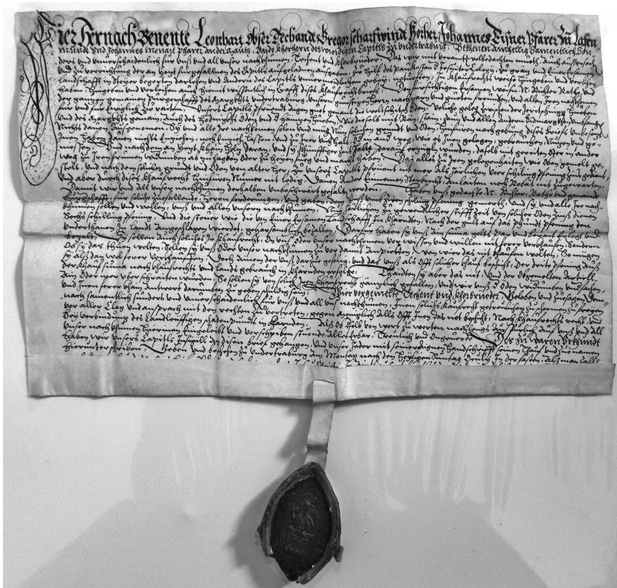
Pečat na listini o oddaji posesti kolegiatnega kapitlja v Dravogradu v zakup trgu Dravograd z dne 23. februarja 1573.