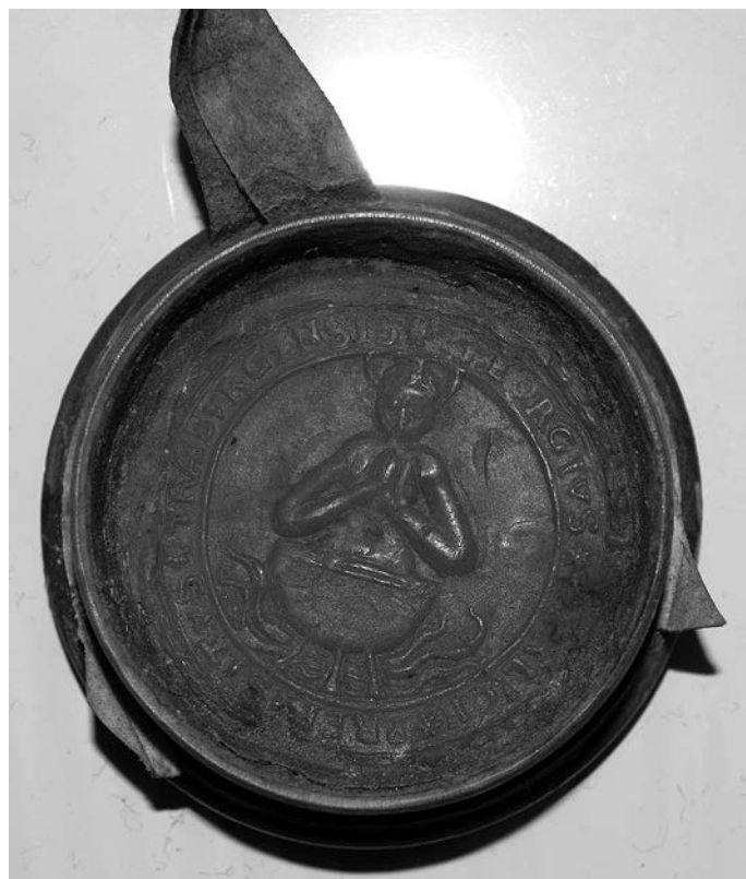
Pečat proštije Dravograd leta 1616.