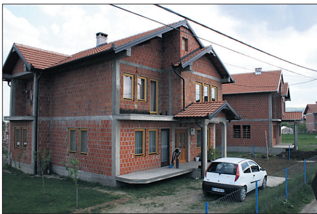
Albanci živijo pretežno v novih hišah brez fasad.

varnosti, OŠ Prčevo so podarili šolske potrebščine, izvedli akcijo čiščenja in ureditve jarkov ter prehodov do kulturnega doma in hiš v vasi Vidanje, v tej vasi so pripravili tudi prostor za izgradnjo nadstrešnice za kmetijske stroje, donirali so hrano ogroženim družinam v občini Klina in se udeležili čistilne akcije v Peči. V izvajanju so projekti donacije računalnikov osnovnim šolam v občini Klina, donacija računalnika organizaciji bivših političnih zapornikov Kosova v Klini in donacija računalnika planinskemu društvu Gjeravica.