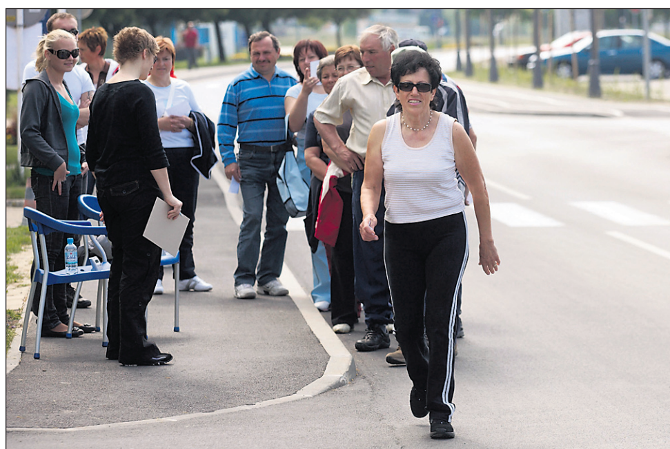
Zdravstveni dom Ptuj in Karate Do klub Ptuj sta na svetovni dan hoje uspešno izvedla test hoje na dva kilometra.