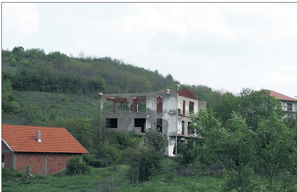
Porušene srbske hiše v vasi Drsnik, spredaj majhna hiša, zgrajena z donacijo.