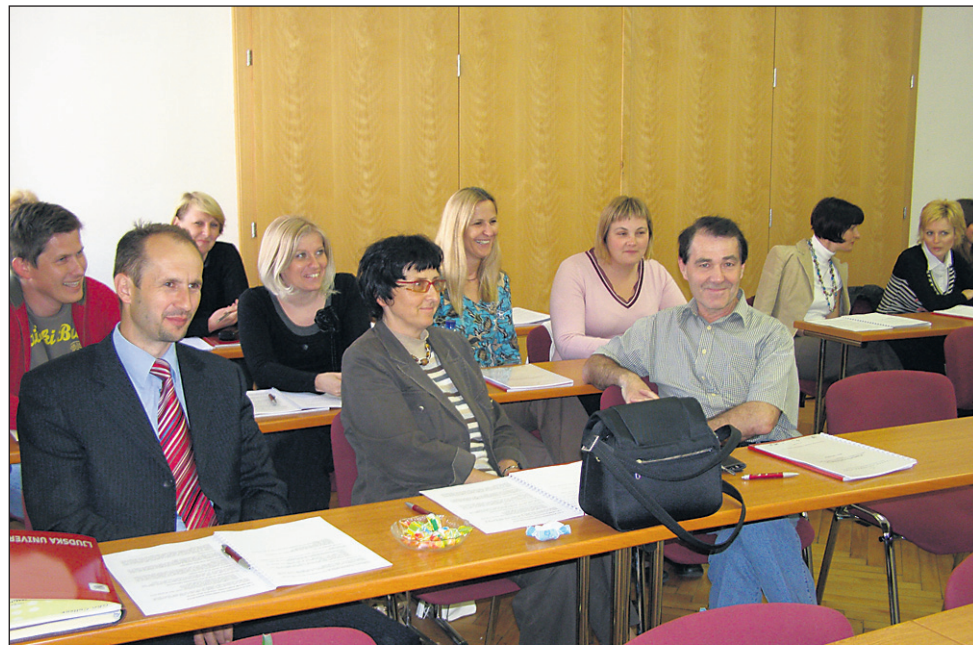
Občinski uradniki so pridobili znanje, ki jim bo pomagalo reševati konfliktno situacije.