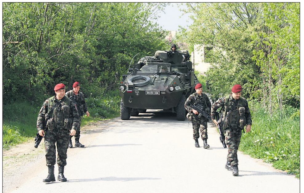
Slovenski vojaki v peš patrolji v srbski vasi Drsnik z večnamenskim vojaškim vozilom Valuk.