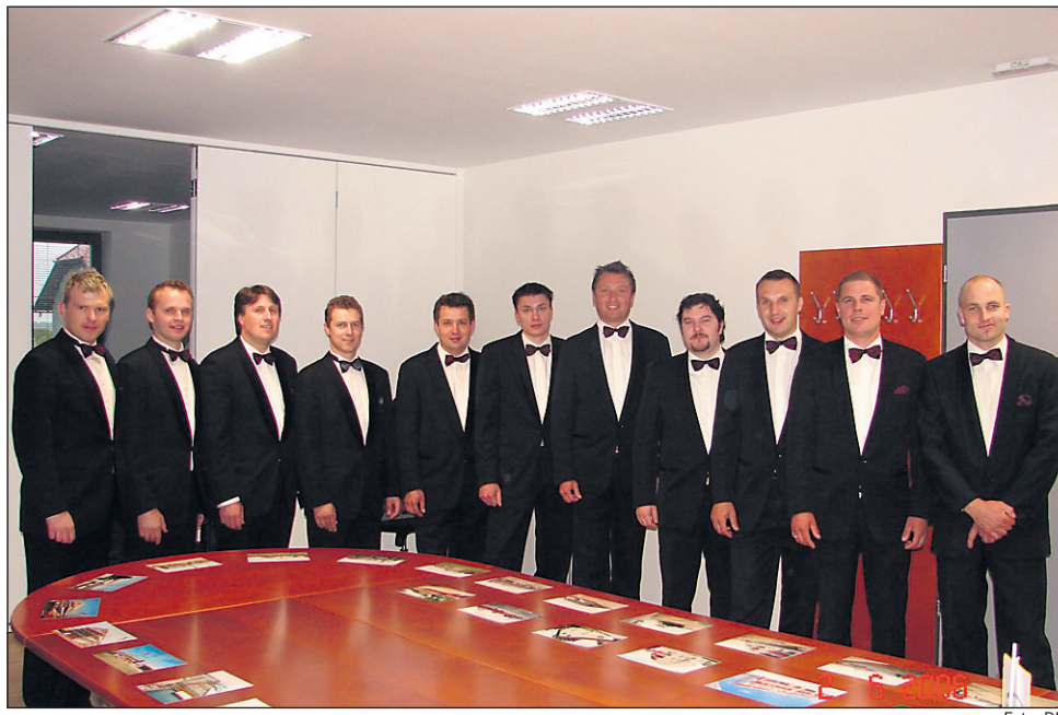
Vokalna skupina Mladi veseljaki