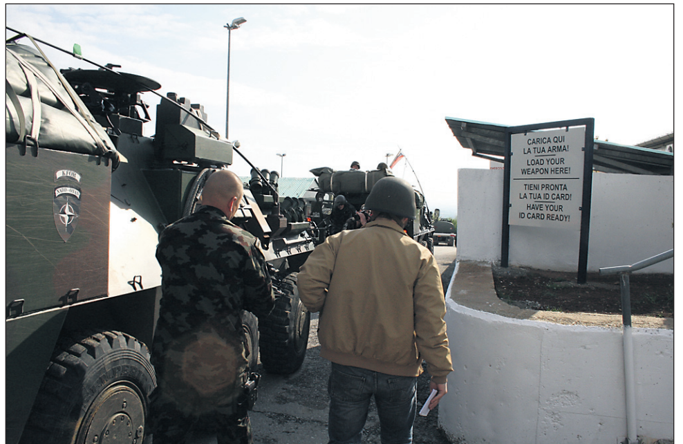
Odpeljali smo se z večnamenskim vojaškim vozilom Valuk