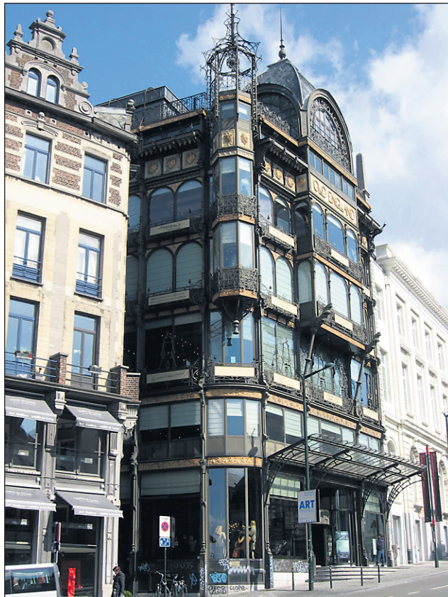
Muzej glasbe – prvovrstna vizualna in zvočna izkušnja

Ker pa je naša biološka zasnova taka, da ne moremo v večnost tacati naokoli, ampak moramo tu in tam tudi počivati, še informacija glede ustanov, namenjenih temu, da vas oskrbijo z zasebnim prostorom, opremljenim s posteljo in blazino, kamor lahko po napornem dnevu raziskovanja položite svoje trudo telo. Tukaj pač ne moremo mimo dejstva, da je Bruselj center EU, zato so cene hotelov tudi temu primerne (čeprav z malo truda lahko najdete tudi hotel, ki vas bo prenočil za precej ugodno ceno). S tega stališča priporočam uporabo enega izmed mnogih hostlov, ki imajo skoraj vsi po vrsti v svoji ponudbi tudi sobe s privatno kopalnico, tako da ste na istem kot v hotelu, le manj boste plačali. Tako hotelov kot hostlov ne iščite v samem centru, ampak malce izven centra. Cene so občutno nižje in v centru ste po zaslugi prej omenjenega odličnega javnega prevoza