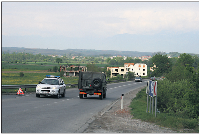
Na območju je precej patrolj Kforja in domače policije. V ozadju porušene srbske hiše.

Omenjena skupina je zaključila projekt usposabljanja kmetov v pravilni molži, donirali so igrače vrtcu Klina, donirali so hitre teste za ugotavljanje mastitisa pri kravah, OŠ Drenovac so donirali seme za travo, knjižnici v Peči in Klina so podarili slovenske knjige, zgradili so računalniško učilnico v OŠ Gremnik, popravili so cesto v srbsko vas Berkovo, donirali so hrano katoliški skupnosti v Glodnjah, izobraževali učence od 1. do 4. razreda v OŠ Drenovac iz prometne