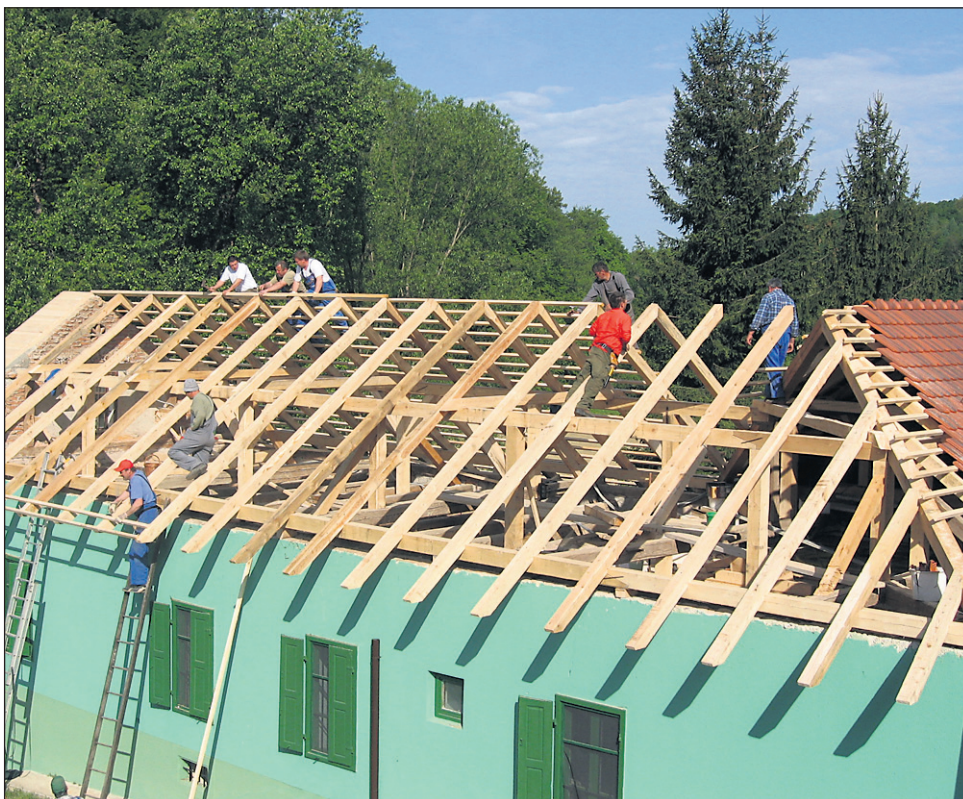
Cirkulanski lovci so z veliko akcijo čez prvomajske praznike popolnoma obnovili celotno ostrešje lovskega doma.

Sicer pa veliko delovno akcijo cirkulanskih lovcev obeležuje še ena posebnost: »Kot je znano, smo pobrateni z lovsko družino iz Kranjske Gore, ki so se izkazali kot pravi prijatelji. Kljub veliki razdalji se je kar veliko število lovcev LD Kranjska Gora čez prvomajske praznike pripeljalo v Haloze pomagat lovčcem v Cirkulaneh na delovni akciji 'nova streha'. To je gotovo nepozaben dogodek, ki bo tesno sodelovanje obeh LD še samo poglobil. Tu seveda lahko samo skromno izjavim: