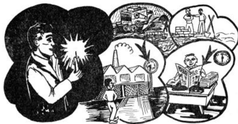
V tej temi nikakor ne najdem notranjih rezerv.