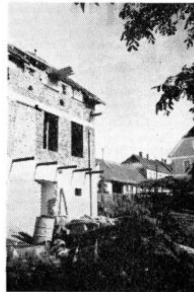
Na fotografiji: Lenarško gradbeno podjetje gradi te dni učiteljska stanovanja v Gradišču.