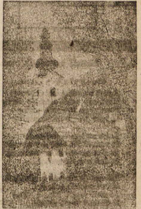
Oj zemlja širna, zemlja lepa...

kozolec je zagorel na koncu vasi. Vnemala se je borba in prvi bataljon je v naskoku odgnal »rdeče kravate«. Najmočnejši pritisk je na tretji bataljon in videti je, da ne bo vzdržal. Beli izdajalci kažejo steze bataljonu za hrbet. A prvi bataljon dobro manevrira. Tiščimo in tiščimo daljnogled, da nas bole oči. Borba dosega vi-