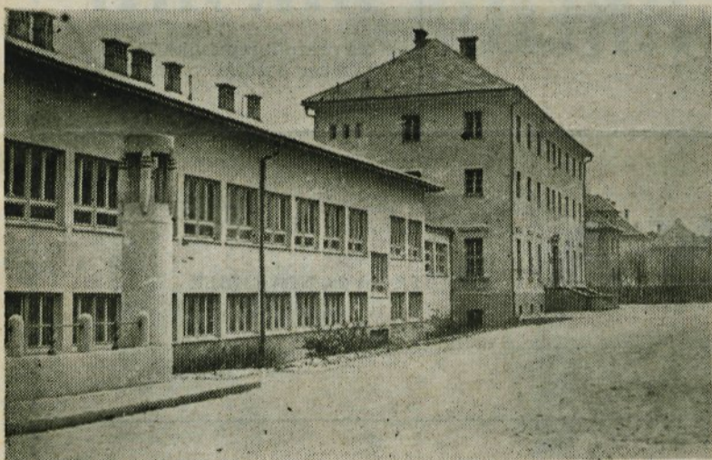
Samski dom, ki je sedaj še prazen, bo konec koncev vendar le začel služiti svojemu namenu

jim bila zagotovljena vsa oskrba in kjer bi se lahko v prostem času kulturno izživljali. — Dom bi lahko sprejel v oskrbo blizu 160 stanovalcev, kapaciteta kuhinje, ki je prirejena po vseh modernih predpisih, pa bi lahko pripravila najmanj 700 obrokov enolončnic. Pretežna večina kamniških delovnih organizacij trenutno kupuje enolončnice za svoje sodelavce v restavraciji »INDUPLATI« Jarše, kar pa je razumljivo povezano s precejšnjimi stroški, ki jih terjajo dovoz. Kuhanje enolončnic, ki ga predvideva sedanji »SAMSKI DOM« v Kamniku, bi rešilo tudi to vprašanje.