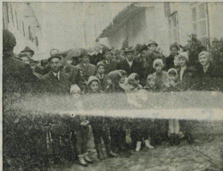
Predstavniki kulturne javnosti iz Ljubljane in Kamnika, šolska mladina in meščani pri počastitvi spomina Frana Albrehta

»V življenju tro se duše kakor v stopah, trpljenja mlini pa jih zmeljejo v prežlahten kru dobrote in ljubezni.«