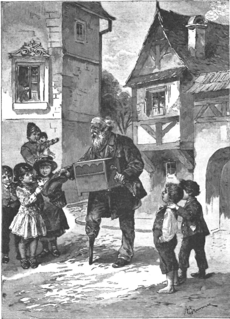
⌞ Radeckega veteran ⌞