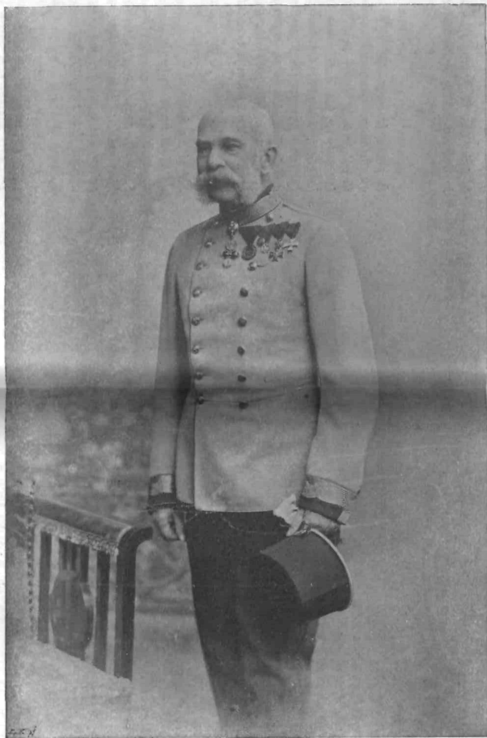
Cesar Franc Jožef I.