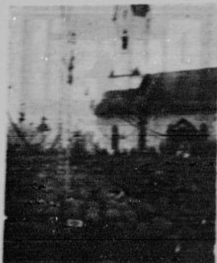
Prošnja pri sv. duhu.