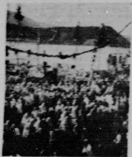
Z ekzarističnega kongresa v Trevisu.