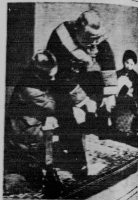
Japonski ministar, ki gre na audienca k cesarju v impr. dvorcu, preden posluša prošnje cesarjeve palače.