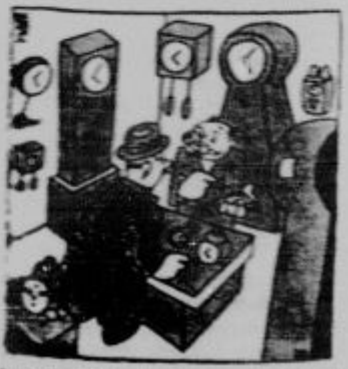
«Kako pa morete živeti, če prodajate vse ut po lastni ceni?» «Jha, veste, zaslužim na popravilih...»

Kupujte pri tvrdkah, ki inserirajo v „Domoljubu!“