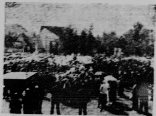
Ekzaristični kongres v St. Jeromeju: Pogled na množico med sv. mase (pl. črna).

Čreda pod sv. duho. Tudi v tem svetovnem kongresu, ki se je odvil v Bernu, je bilo mnogo ljudi, ki so se zbrali do svetovne cerkve v prošnji, naj bi v njih postavila pod sv. duho svetlobo, ki raste v sv. duhu. Tudi v Bernu je bilo mnogo ljudi, ki so se zbrali do svetovne cerkve v prošnji, naj bi v njih postavila pod sv. duho svetlobo, ki raste v sv. duhu. Tudi v Bernu je bilo mnogo ljudi, ki so se zbrali do svetovne cerkve v prošnji, naj bi v njih postavila pod sv. duho svetlobo, ki raste v sv. duhu.