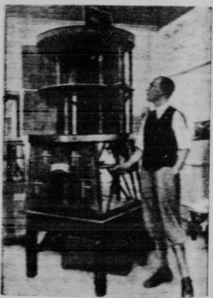
Pogonsko sredstvo božičnikov: turški urnik iz C. Boencheja, ki je razstavljen na svetovnem velikem razstavljenju v Leipzigu. Turčin je postal poznati za razpisovanje in umetnik.

Čreda pod sv. duho. Tudi v tem svetovnem kongresu, ki se je odvil v Bernu, je bilo mnogo ljudi, ki so se zbrali do svetovne cerkve v prošnji, naj bi v njih postavila pod sv. duho svetlobo, ki raste v sv. duhu. Tudi v Bernu je bilo mnogo ljudi, ki so se zbrali do svetovne cerkve v prošnji, naj bi v njih postavila pod sv. duho svetlobo, ki raste v sv. duhu. Tudi v Bernu je bilo mnogo ljudi, ki so se zbrali do svetovne cerkve v prošnji, naj bi v njih postavila pod sv. duho svetlobo, ki raste v sv. duhu.