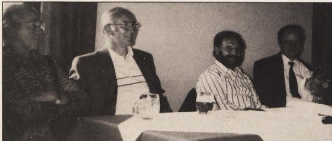
Pogled na udeležence občnega zbora Zveze slovenskih izseljencev