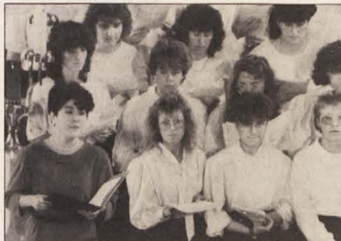
MePZ „Danica“ poje Schubertovo mašo

Vstopnice dobite v obeh slovenskih knjigarnah v Celovcu, pri posojilnicah, društvenih in uro pred koncertom na večerni blagajni v Domu glasbe.