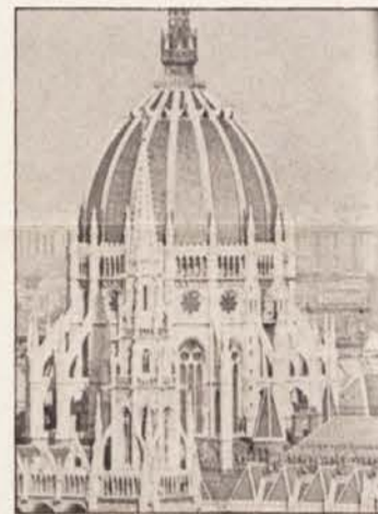
Budimpešta: stolp skupščine