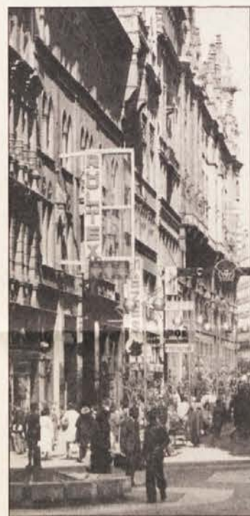
Na sporedu je tudi izlet v Budimpešto