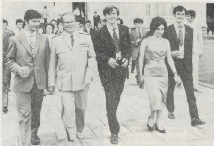
Predsednik Tito z mladino