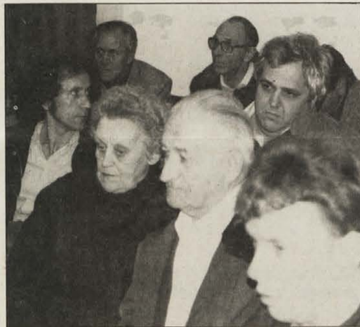
Zainteresirana publika v Šentjakobu

Več diskutantov v Bilčovsu pa je vehementno podprlo kandidaturu „Drugačne Koroške“, saj „imamo demokratično pravico do svoje poti“.