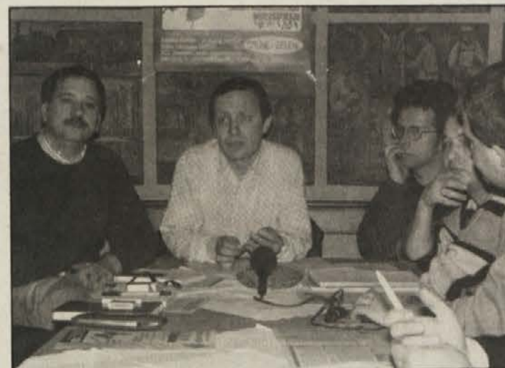
Državni poslanec Peter Pilz v Celovcu

uničenje polovice sedanjih kmetij, pravi Pilz. Sedaj v Evropski skupnosti vsake dve minuti propade ena kmetija,