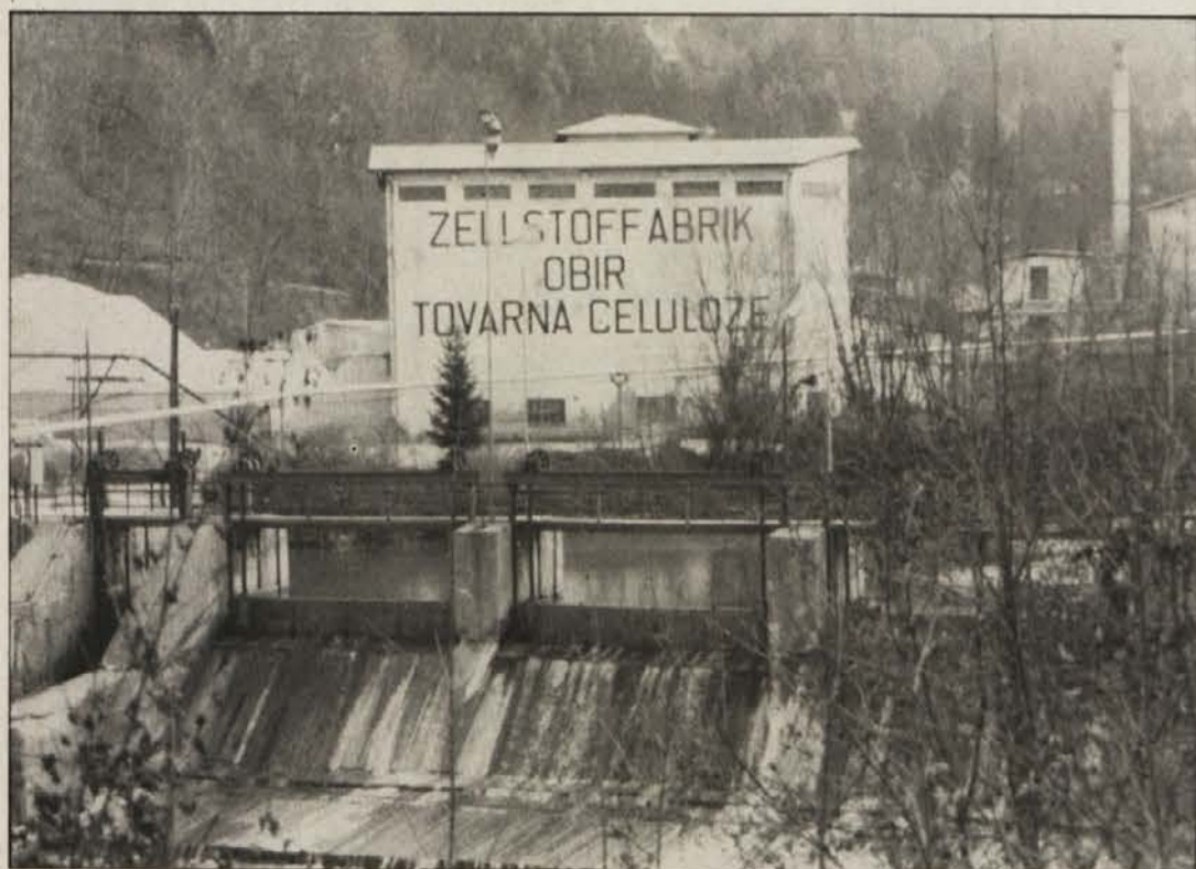
Tovarna celuloze Obir je morala začasno zmanjšati proizvodnjo za 40 odstotkov.