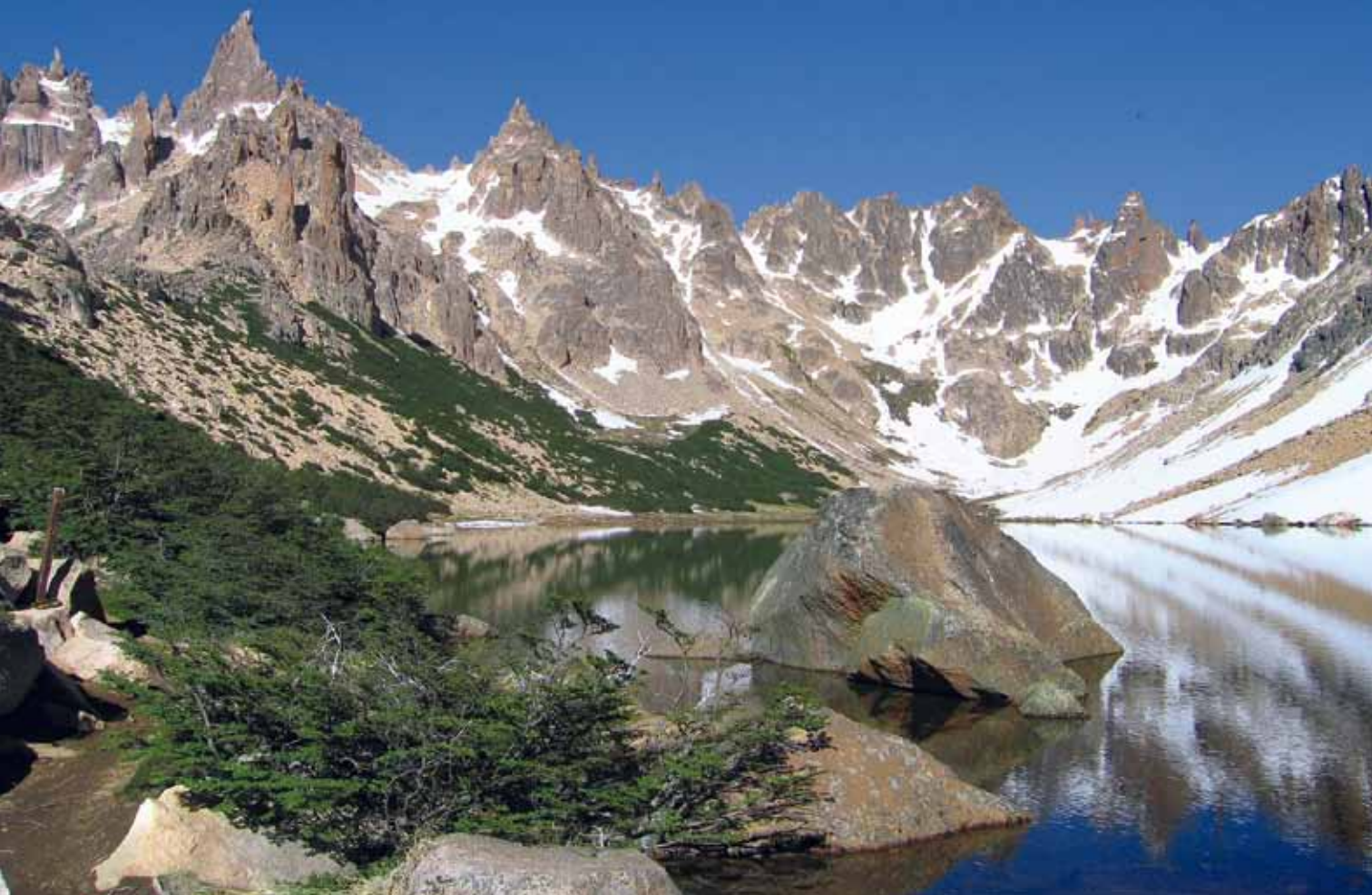
Laguna Tonček, Katedralske špice, Torre Principal