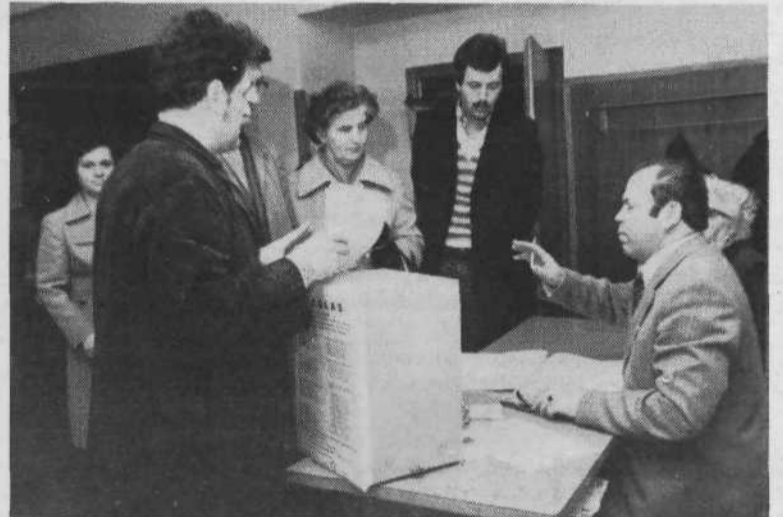
KS POLJANE, VOLIŠČE 17 – v volilnem imeniku je bilo vpisanih 958 volilcev. Združeno delegacijo so volili za otroško varstvo, socialno skrbstvo, invalidsko-pokojninsko zavarovanje in zaposlovanje, za druge SIS pa so volili posebne delegacije.