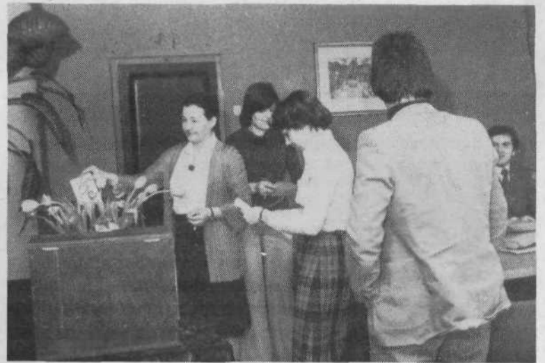
JUGOBANKA, TEMELJNA BANKA LJUBLJANA – 270 vpisanih volivcev. Za vse SIS so volili posebne delegacije.