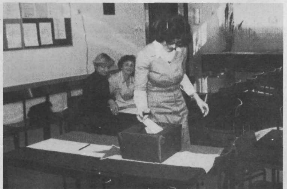
VVZ ANE ZIHERL – 95 vpisanih volivcev. Volili so posebno delegacijo za otroško varstvo; združeno za kulturo, telesno kulturo in izobraževanje; združeno za socialno skrbstvo, invalidsko-pokojninsko zavarovanje, raziskovalno dejavnost in zdravstvo.