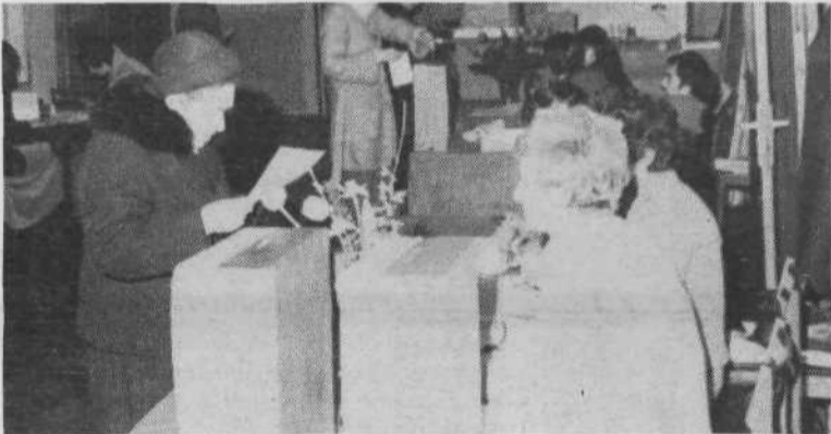
KS AJDOVŠČINA, VOLIŠČE 3 – vpisanih 937 volilcev. Združeno delegacijo so volili za socialno skrbstvo, invalidsko-pokojninsko zavarovanje in zaposlovanje, za druge SIS so volili posebne delegacije.