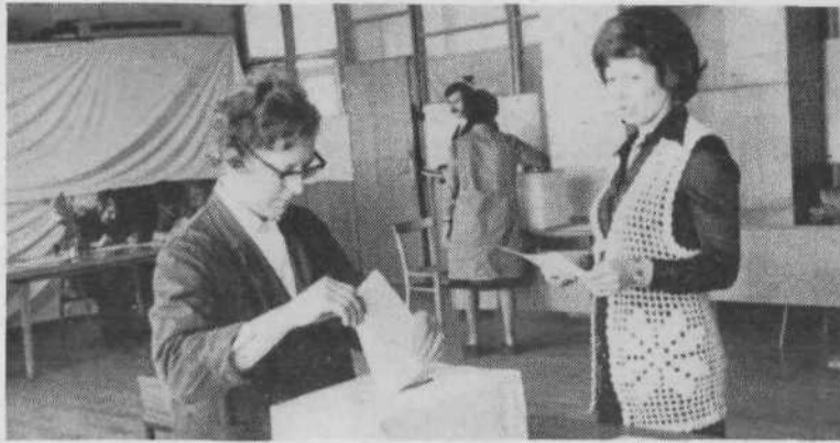
ISKRA, TOZD VEGA – 456 vpisanih volivcev. Za vse SIS so volili posebne delegacije.