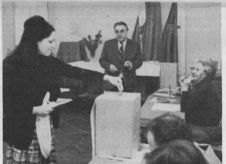
KS TABOR, VOLIŠČE 25 – vpisanih 595 volilcev. Volili so združeno delegacijo za SIS otroškega varstva, socialnega skrbstva, invalidsko-pokojninskega zavarovanja in zaposlovanja, posebne delegacije za SIS za izobraževanje, za raziskovalno dejavnost, za kulturo, za telesno kulturo, za zdravstvo, za stanovanjsko gospodarstvo in združeno delegacijo za deležiranje v skupščine drugih SIS.