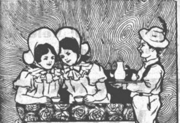
Ponos vsake gospodinje je dobra kava.

— Zdravilo za sušico ali tuberkulozo (jetiko) je baje izumil nemški učenjak profesor Behring, katerega ima človeštvo že zahvaliti za konjski krvni ocedek („serum“), s katerim se zdaj zdravi davica ali difterija. Behring se ni na koncu svojih poskusov, dajal je svoje sredstvo dosedaj samo živalim, človeku še nobenemu. Ob drugem novem letu upa, da mu bo mogoče izročiti svetu svojo iznajdbo. Imenuje jo za zdaj skrivnostnim znamenjem „T. G.“