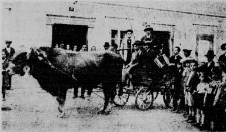
Zaplata: v Francelj iz Voljevih utov pri Miru se pebe s svojimi prijatelji na spretnost. Vpregel je pa kar bika pred koleselj. Koliko konjskih sil ima ta goveja sila, ne vemo. Vemo le toliko, da je bik tri leta star, da tehta 900 kg in da je tako krotak, da se upajo k njemu tudi otroci. Seveda so izločki vzbujali povsod veliko pozornost.

Kmetje, oklenite se Kmet. zveze! Kmetska zveza zastopa koristi kmetskega stanu!