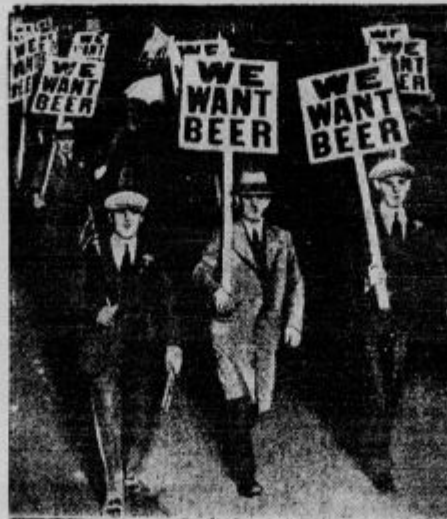
«Hocemo piva!» V raznih ameriških mestih je v zadnjem času prišlo do nočnih demonstracij proti zakonu, ki prepoveduje izdelovanje alkoholnih pijač. Demonstranti so nosili table z napisi: »Mi hočemo piva!« Govorniki so na tleh zborovajili za-