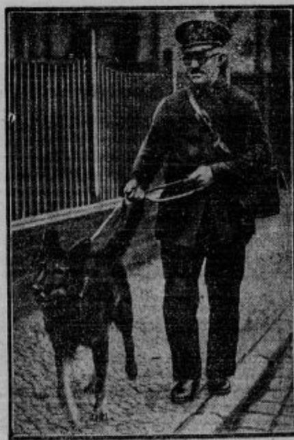
Pismonoša s psom. Ker so se v Nemčiji v raznih mestih zgodili predrzni napadi na pismonoše, ko so nosili večje denarne vsote, so sklenili, da bodo pismonoše imeli odslej s seboj pse-varuhe.

KUPUJTE PRI TVRDKAH, KI INSERIRAJO V »DOMOLJUBU«