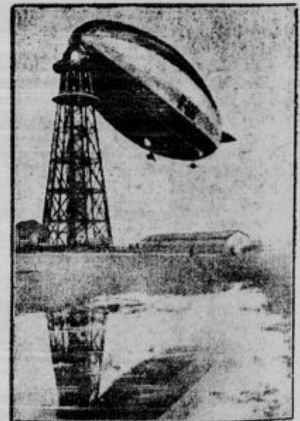
Angleško zračno ladjo »R 100« bodo prihodnje dni razdeljali in prodali kot staro železo. Vlada je sklenila, da odslej ne bo več gradila stitnih zračnih velikanov, ker so se pokazali neuporabnim in nepraktičnim.