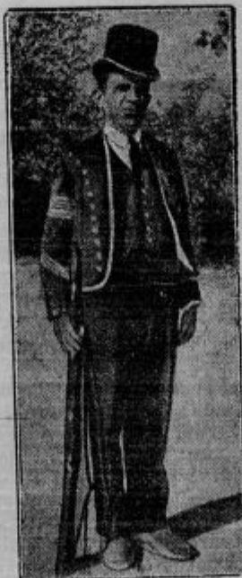
Policist v cilindru. Tako so oblečeni in uniformirani policisti ne morda v kakem predpustnem sprevedu, marveč v Barceloni. Nosijo čevlje iz gumijsa, da bi lažje zalotili tatove.