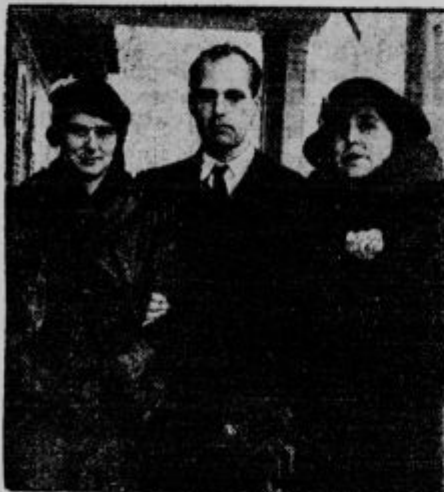
Romunska kraljica Marija je na obisku pri svoji najmlajši hčerki princezi Ileani v Monakovem. Na sliki od leve: Princeza Ileana Habsburška, Anton Habsburški, soproga romunske kraljevske princeze in kraljica-mati Marija