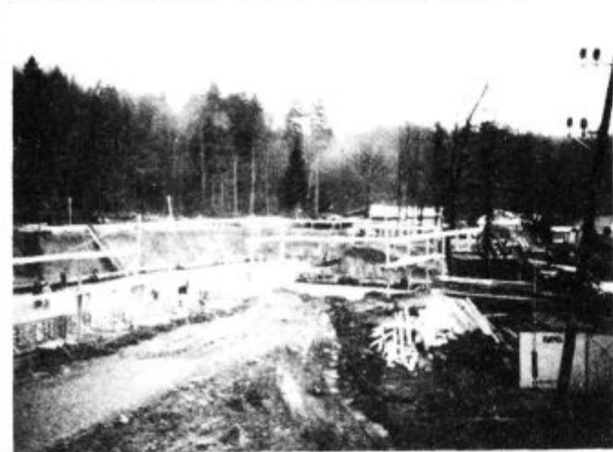
Danes še gradbišče, prihodnje leto pa privlačen hotel

Pospešeno poteka gradnja hotela Agata v Črnem lesu. Investitor Agrokombinat Lenart in izvajalec del gradbeno podjetje Grosuplje se nadejata lepega vremena, da bi letos opravila vsaj zemeljska in osnovna gradbena dela. Tehnične podatke smo objavili v prejšnji številki Domačih novic, zaradi vloge in pomena, ki ju bo hotel odigral v turističnem razvoju naše občine, pa je potrebno, da o tem zapišemo nekoliko več. Večina turističnih agencij po svetu ugotavlja v zadnjih letih povečan interes za kontinentalni turizem. To pomeni, da turisti počasi zapuščajo obale morja in si privoščijo počitek in dopust nekje v notranjosti. Naši sosede Avstriji zaslužijo s kontinentalnim turizmom desetkrat več, kot mi s svojo 920 km dolgo obalo. Znano in hočejo ponuditi turistu kaj več kot samo prehrano in prenočišče.