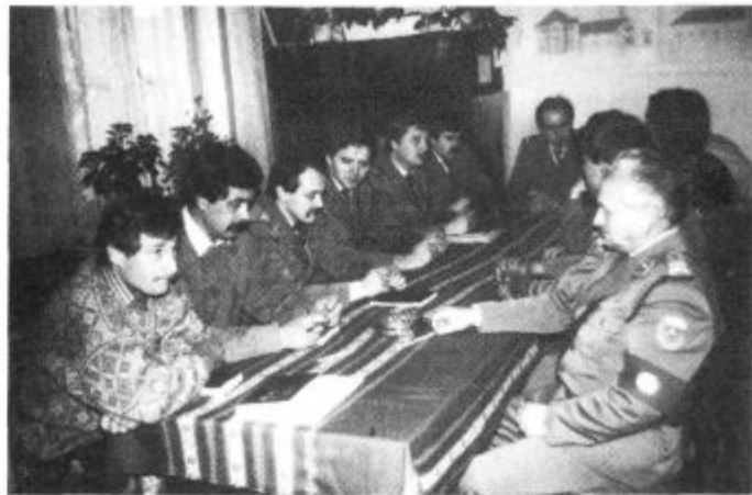
Kratek delovni dogovor vselej rodi uspeh