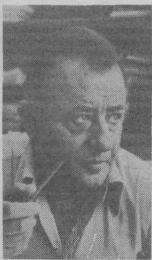
direktor DO Kemična tovarna Moste — Protektor.