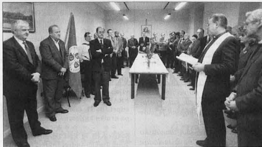
S petkove slovesnosti ob odprtju novega sedeža SSk

Od peteka, 10. t.m., imata krožek Virgil Šček in stranka Slovenske skupnosti nov sedež. Ta dan so namreč uradno in slovesno odprli nove prostore v ul. Giacinto Gallina 5, kjer se je zbralo res veliko število ljudi, od aktivnih članov stranke pa do njenih prijateljev in somišljenikov.