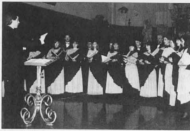
Ljubljanski madrigalisti med izvajanjem

Ljubljanski madrigalisti so profesionalen pevski sestav, ki se opredeljuje za zahtevno glasbo domačih in tujih avtorjev; na mednarodnih zborovskih tekmovanjih so že večkrat zasluženo prejeli različna priznanja. V glavnem so njihovi