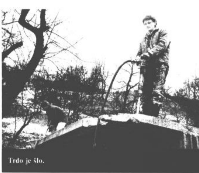
Trdo je šlo.