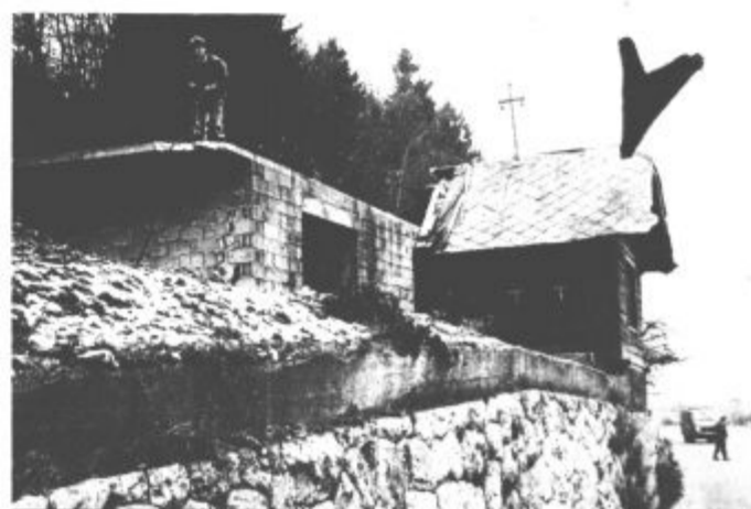
Ostali je objekt, ki bi ga lahko porušili brez škode