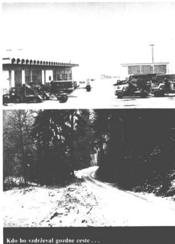
Kdo bo vzdrževal gozdne ceste...