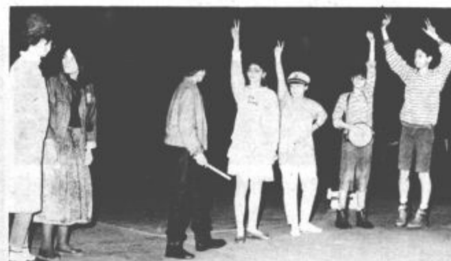
Učenci osnovne šole Šalek med prikupnim programom