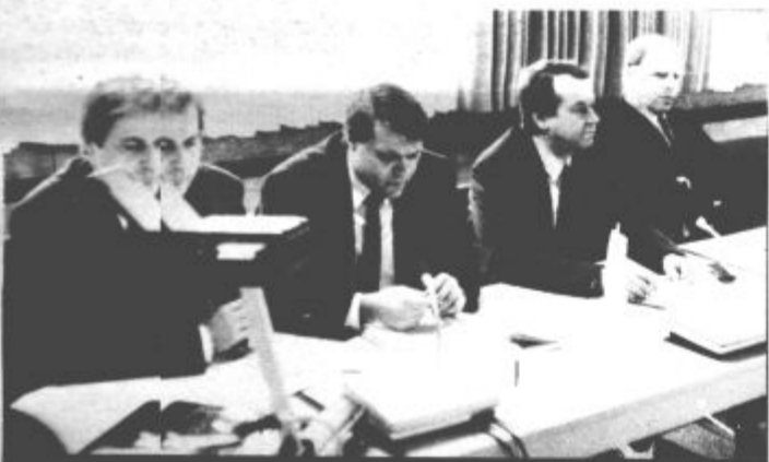
V petek so se novinarjem odgovarjali na vprašanja najvišji predstavniki Koncerna Gorenje, predsednik upravnega odbora in in direktorji podjetij.