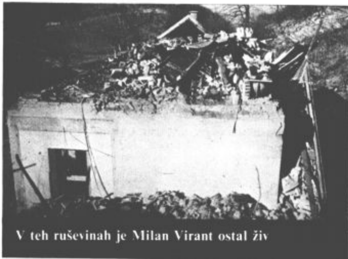
V teh ruševinah je Milan Virant ostal živ