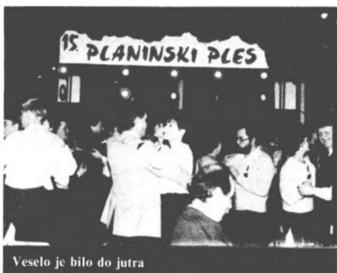
Veselo je bilo do jutra