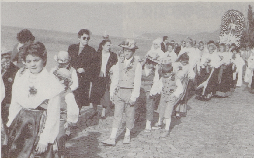
Roženvenska procesija v Barkovljah v nedeljo, 4. oktobra letos