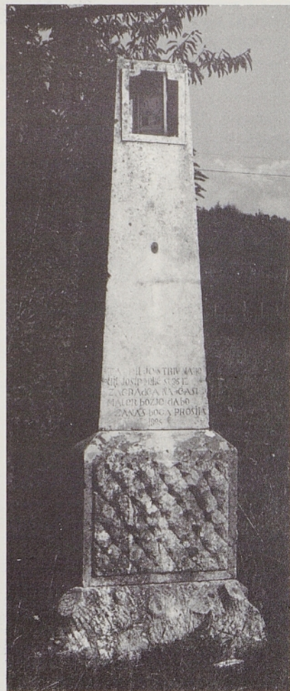
SLIKA NA PLATNICI: Kamnit pil v Zagradcu je pričra naše prisotnosti in del naše kulturne zgodovine.