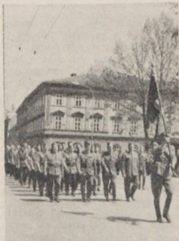
Tudi letošnjega pohoda po poteh partizanske Ljubljane so se udeležili kurirji in vezisti NOV

Končno je tudi na Jančah, naj- višjem kraju v naši občini, zavla- dala prava pomlad. Dolga in mrzla zima je okovala zemljo v led in vse je kazalo, da se ne bo kmalu odtajala. Pomlad je s precejšnjo zamudo pregnala zi-