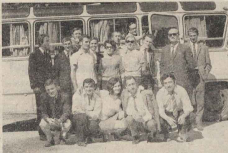
Člani aktiva mladih komunistov iz Zelene jame na izletu v Ravne na Koroškem