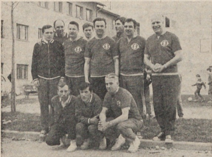
Zmagovalna kegljaška ekipa Saturnusa

jim je Izolirka nevarno približevala. Drugi dan je nastopila ekipa Saturnusa, ki se je tudi potegovala za prvo mesto. Odlična igra Lunarja (426) Tršana ml. (404) in Pirca (393) pa je zadostovala za prvo mesto, čeprav z razliko samo 2 kegljev.