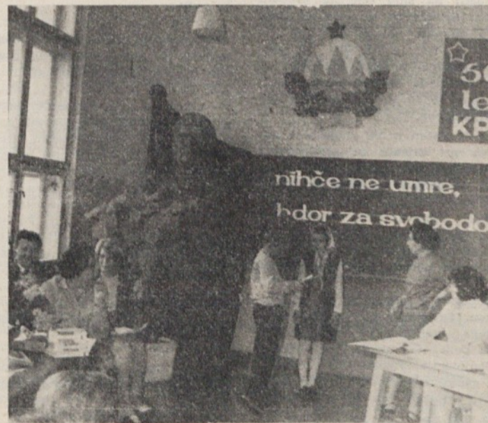
Občinskega tekmovanja za Moškričevo značko, katerega organi- zator je bila osnovna šola Polje, so se udeležili pionirji z vseh petih centralnih osnovnih šol občine Moste-Polje