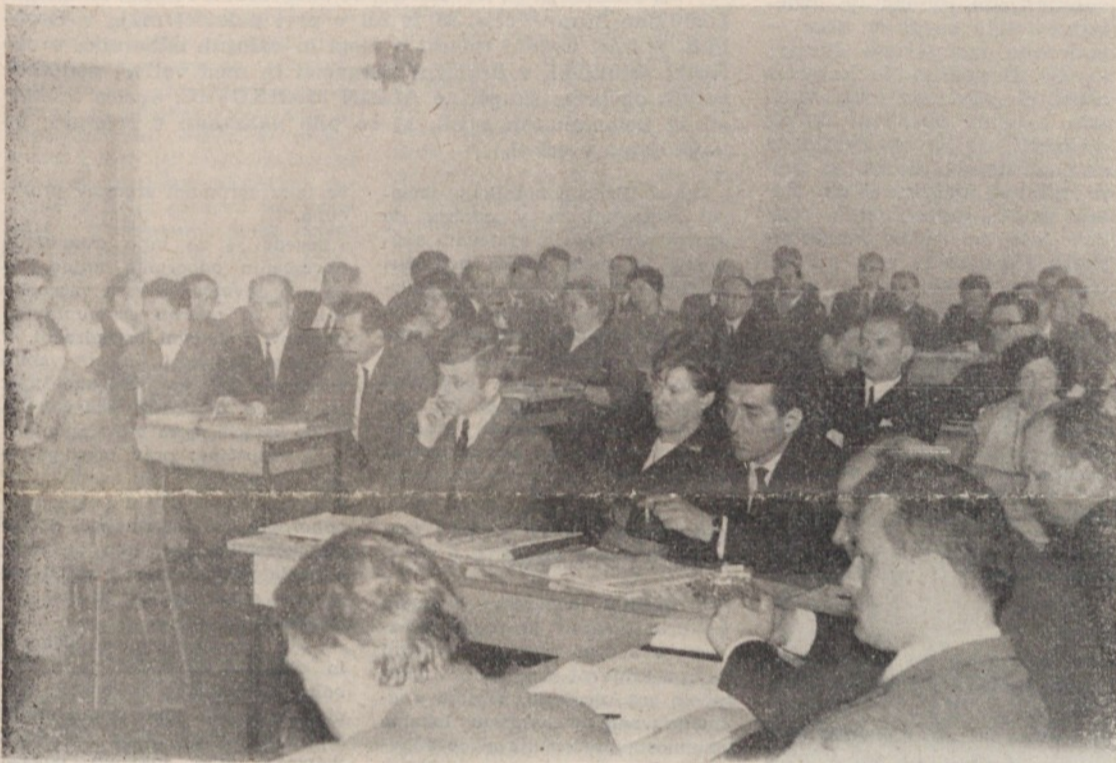
Novoizvoljeni odborniki pozorno spremljajo potek seminarja v Grobljah. Več o tem berite na 2. strani