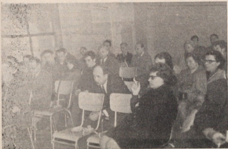
Udeleženci 4. krajevne konference ZK Polje pozorno spremljajo njen potek

mesto sprejema in zaposlitve, ki prebivajo na področju krajevne konference ZK Polje.