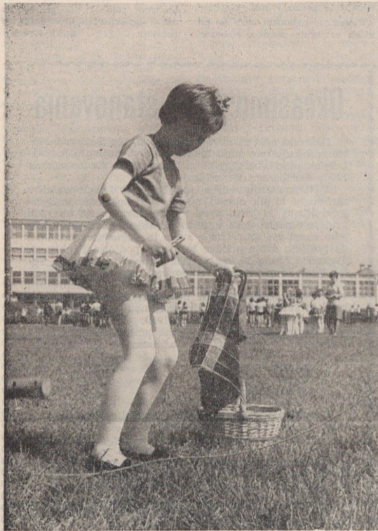
Deklice 3. razredov nastopajao v zabavni štafeti: perice

Višji razredi so se spoprijeli v pravih športnih panogah: 5. razredi so tekmovali v igri med dvema ognjema, 5. in 6. razredi so postavili skupne ekipe za orientacijski pohod prek Golovca, 6. in 7. razredi so igrali rokomet, 6. 7. in 8. mail nogomet in 8. rapredi še košarko. Tako so bile