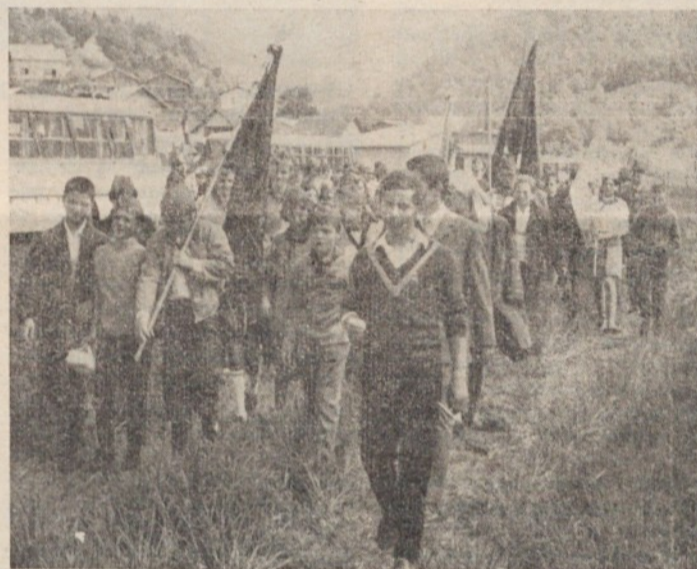
Posnetek je sicer že nekoliko star, toda za kroniko dogodkov še vedno aktualen in kaže moščanske šolarje ob prihodu na proslavo v Velenju

Tako je v praksi pretekla mandatna doba ta zbor nastopal bolj kot del občinskega zbora v relativno številčno slabši zasedbi in dejanski udeležbi v normativnem delu naše skupščine.