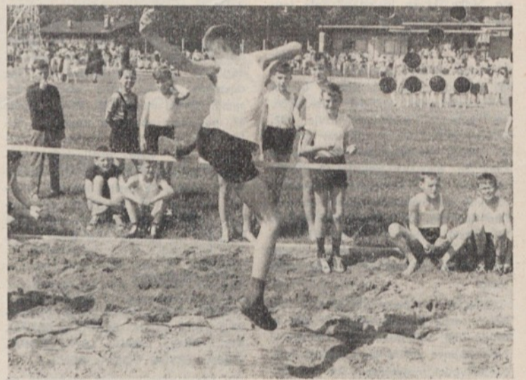
Prvi skok v višino bo kot kaže uspel. Morda bo prav tale deček nekoč postal državni reprezentant