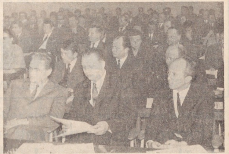
Novoizvoljeni odborniki občinske skupščine Ljubljana Moste-Polje med pogovorom z elektorji iz delovnih organizacij in kandidati za poslance