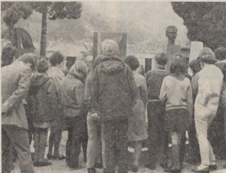
Pionirji osnovne šole Vide Pregarc na grobu partizanskega pešnika Karla Destovnika-Kajuha v Šoštanju

Iz sanj me je predrnil vodnikov glas: »Pojdimo si ogledat še spominsko sobo v šoštanjski šoli!« Spominska soba je v prvem nadstropju. V njej so rokopisi Kajuhovih pesmi, pismo materi in dekletu in spričevalo. Bil je dober učenec. Tu so bile njegove šolske naloge, fotografije iz rane mladosti in iz vojnih časov, pesmi, ki jih je napisal pod psevdominom Drago Jeron. Zatem smo si ogledali še rojstvo