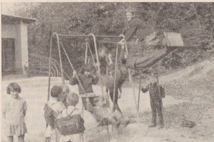
Pri osnovni šoli na Jančah imajo lepo urejeno otroško igrišče, ki nudi otrokom obilo razvedrila in zabave

ne bo treba več jeziti na jame in blato na cesti, saj cesto Besnica- Janče na debelo posipljejo s pe- skom. Prav je, da se izboljšajo življenjski pogoji ljudem na Jan- čah, saj so med vojno veliko pretrpeli in pomagali partizanom.