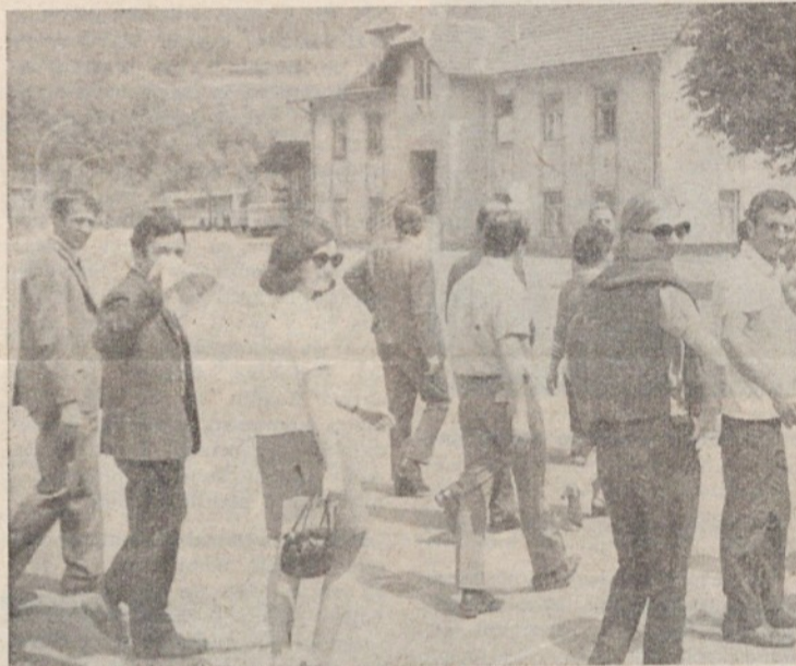
Mladi komunisti iz Jarš in Zelene jame na izletu. O tem berite članek na 2. strani

Tekmovalje in organizacija sta bila na dostojni višini in ni med tekmovalci prišlo do nobenih zastojev in pritožb. Za v bodoče bi pa predlagal: če se že tekmuje po turnirskem sistemu, bi morali biti pokali, diplome in nagrade razstavljene na samem prizorišču, da tekmovalci vidijo, za kakšno trofejo se bojujejo in na čast katerega praznika nastopajo.