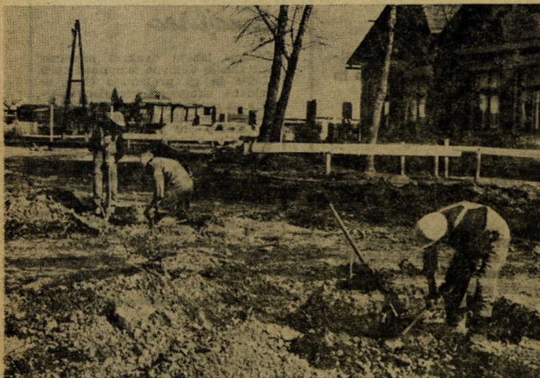
Ti delavci gradbenega podjetja, ki so gradili skladišče, so zelo disciplinirano uporabljali zaščitne čelade. Tega pa ne vidimo v naši TOZD Tovarna kotlov in TOZD odpreskov. Ali imajo tam res tako trde glave, da jim predpisane čelade niso potrebne