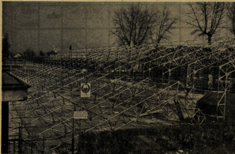
Sedaj je skladišče že pokrito. Takole kot kaže slika, je izgledalo v času gradnje. Pravijo, da je taka gradnja hitra in cenena