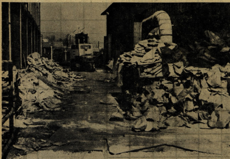
To smetišče se nahaja na dvorišču. Tisti »packoni«, ki ustvarjajo tako okolje, bi prav lahko bolje pometli pred svojim pragom, saj smo v času, ko se vsi zavzemamo za lepoto okolja